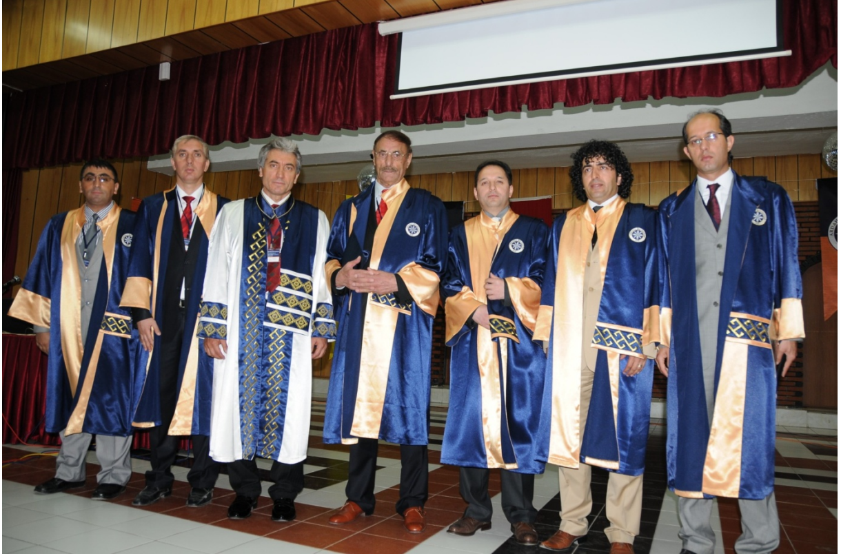
Ardahan Üniversitesi Onursal Bilim Doktoru Unvanı 2010