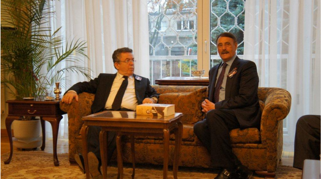
Âşık Şeref Taşlıova Varşova Büyük Elçisi Yusuf Ziya ÖZCAN ile 10 Kasım 2012