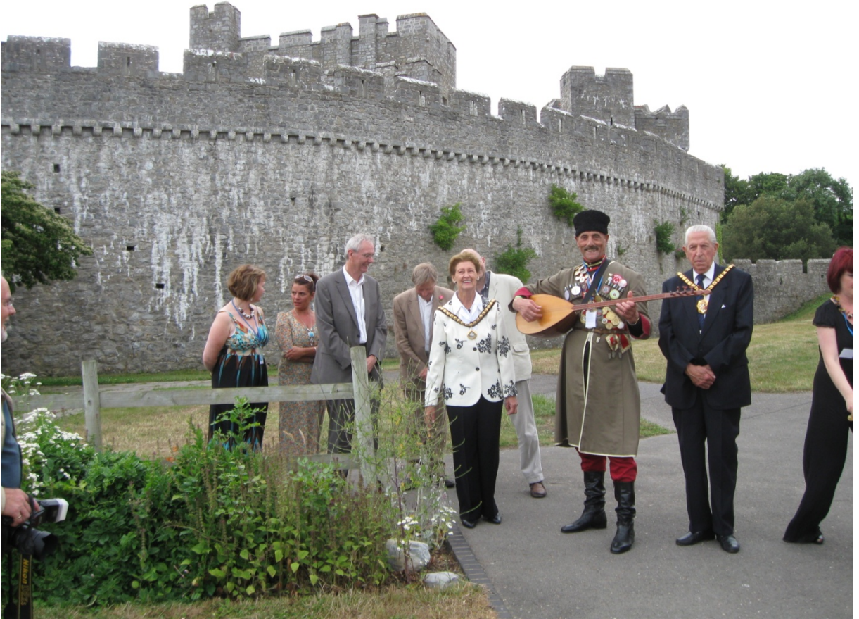
İngiltere Galler Storytelling Festival 2009