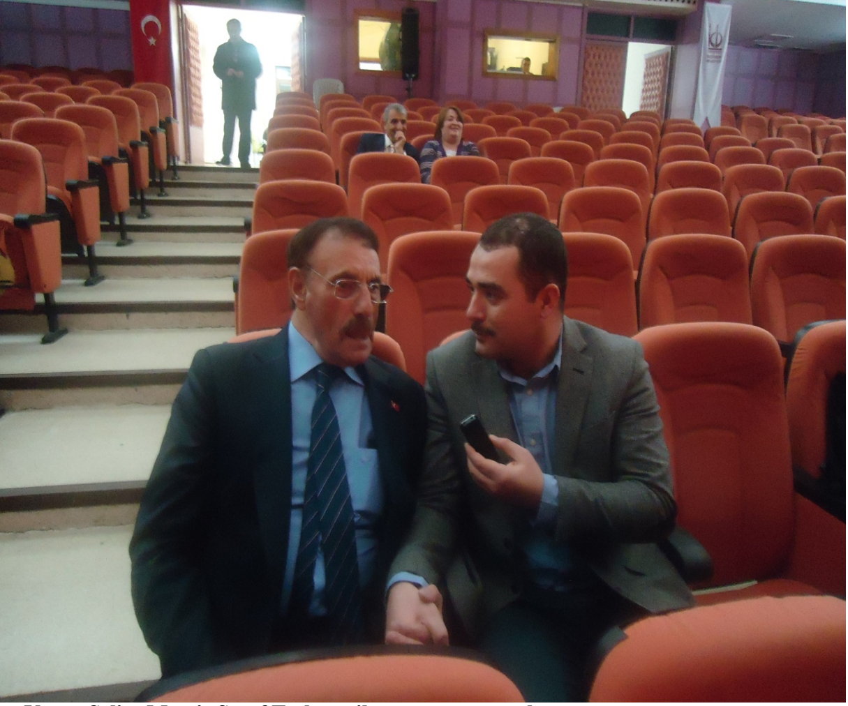
Yavuz Selim Memiř Őeref Tařhova ile grřme yaparken

(Keçiren Belediyesi Ařıklar Őleni/Ankara 15.02.2013)