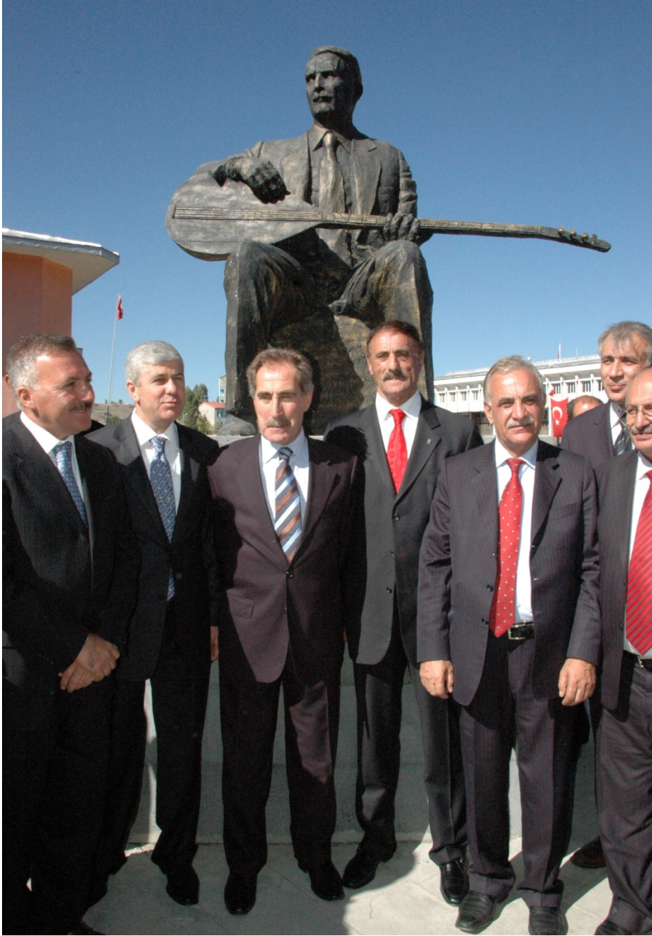
Âşık Şeref Taşlıova Heykeli Açılışı-Kars