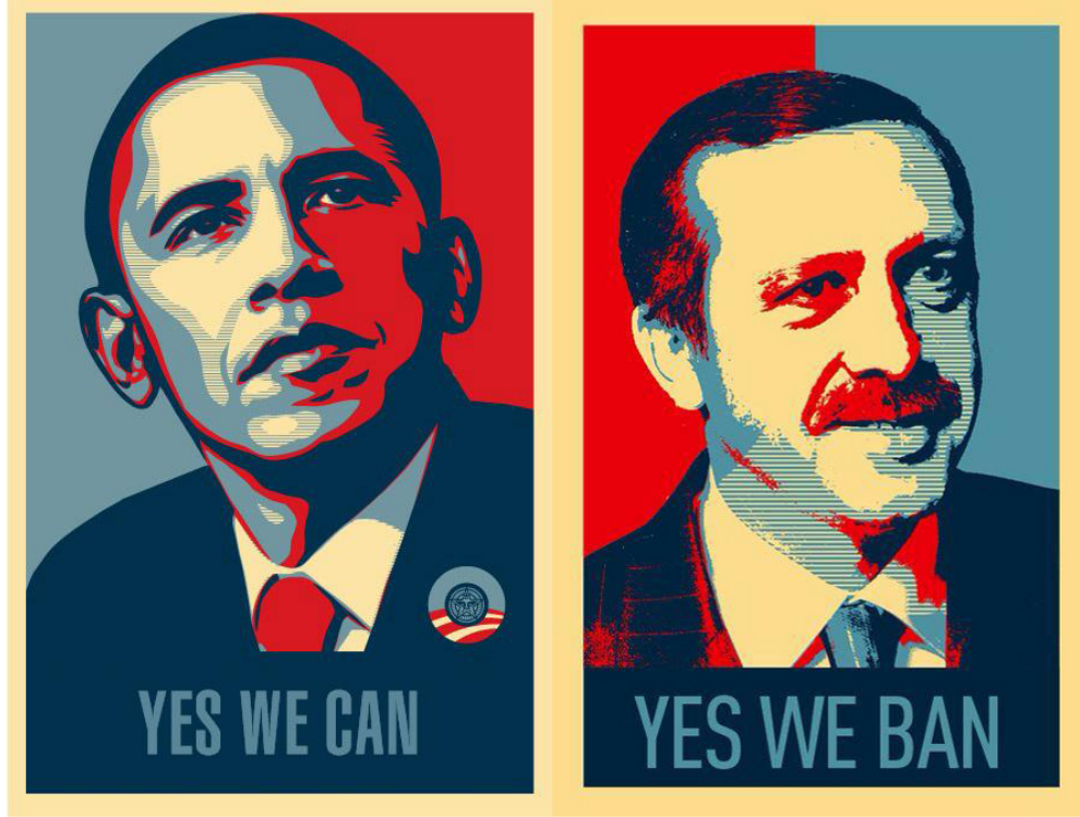
Şekil 3.1 Yes We Ban

Türkiye'de internet erişimine belli koşullarda kısıtlama getirilmesine yönelik yasal düzenlemenin kamuoyu gündemine düşmesi üzerine sosyal medyada yoğun olarak paylaşılan bu caps, 2008 yılında ABD Başkanı Barack Obama'nın 'Yes, we can - Evet, yapabiliriz' adlı seçim kampanyası sırasında kullanılan bir ilanın bozuma uğratılarak yeniden üretilmiş halidir. Caps'te Başbakan Recep Tayyip Erdoğan 'Yes, we ban - Evet, yasaklayabiliriz' sloganıyla gösterilmektedir. Barack Obama'nın 2008 yılında sürdürdüğü kampanyanın görseli, metin olarak 'biz' ve 'yapabiliriz' ifadeleriyle bütünleştirici bir çağrı yaparken bu çağrıyı ABD bayrağına ait renklerin belirgin kullanımıyla hem bütünlüğün hem de farklılıkların bir arada sunulmaya çalışıldığı bir yapıyla gerçekleştirmek hedeflenmiştir. Örnek caps'in metninde ise 'biz ' ifadesi yasaklayanlara atfedilmiştir. Bu kez 'Evet, yasaklayabiliriz' sözü ilanda görünen kişiye yani Başbakan Recep Tayyip Erdoğan'a söylenmiştir. Yasaklamak sözü yapmak sözüne göre çok farklı, negatif çağrışımlar içeren bir sözdür. Örnekte yasaklayan ve yasaklamayan üzerinden ben - öteki ilişkisi kurulmuştur. Sloganların kafiyeli uyumu görselin renk ve grafik öğelerinde de tutturulmaya çalışılmış ve ABD Başkanı Barack Obama'nın siyasi kimliğine paralel bir şekilde Başbakan Recep Tayyip Erdoğan tek adam olarak