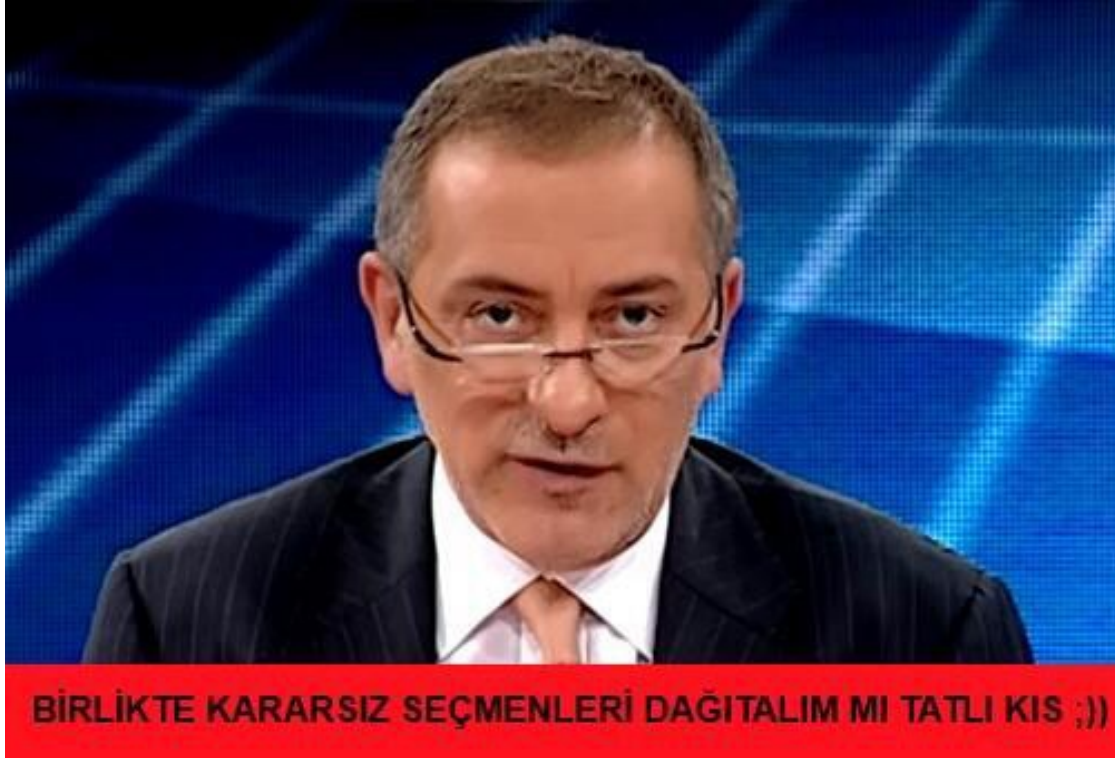
Şekil 3.8 Kararsız Seçmenler