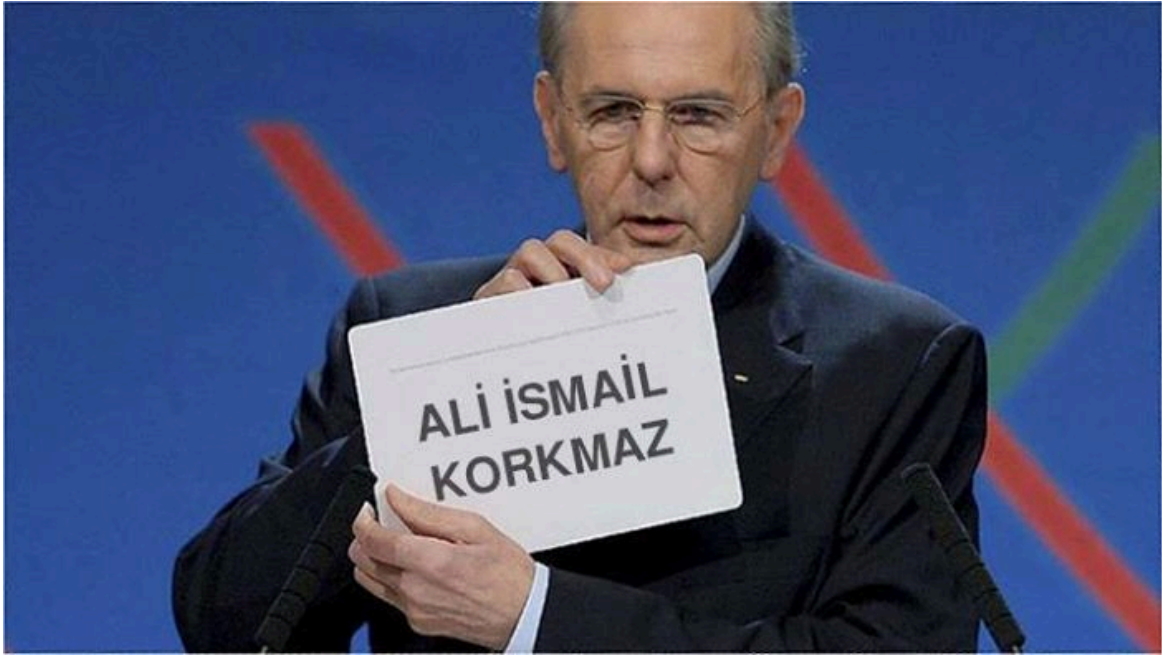
Şekil 3.26 Olimpiyat

Örnek caps te bir görsel bir de metinsel öğeyle bozum ortaya konmuştur. 7 Eylül 2013 tarihinde sonucu açıklanan ve İstanbul'un da aday olduğu 2020 Olimpiyat Oyunları'na ev sahipliği yapacak şehrin belirlendiği oylamaya dair bir fotoğraf görsel öğeyi oluşturmaktadır. Caps teki metinsel öğe ise Taksim Gezi Parkı protestolarına destek amacıyla 2 Haziran 2013 tarihinde katıldığı yürüyüşe müdahale eden polis ve karşıt görüşlü gruplar tarafından darp