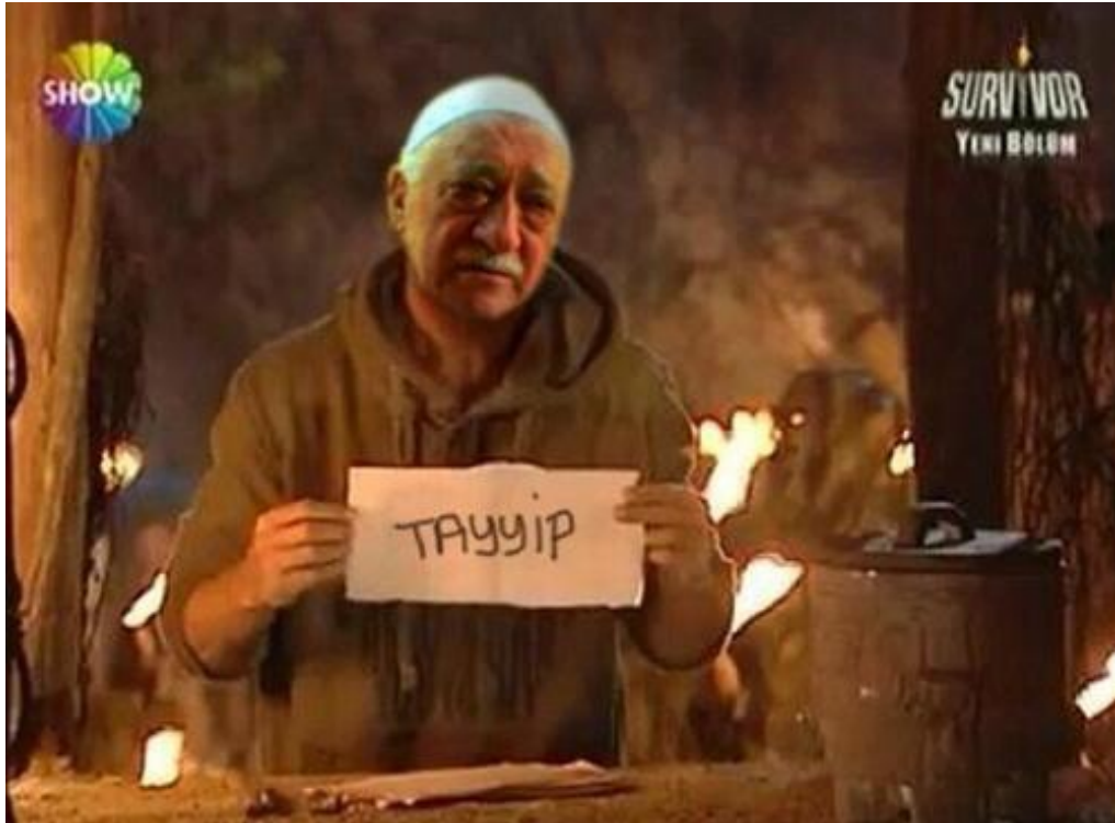
Şekil 3.10 Yarışma

Örnek capste 17 Aralık 2013 rüşvet ve yolsuzluk operasyonu ile başlayan ve kamuoyuna Gülen Cemaati - Adalet ve Kalkınma Partisi çatışması perspektifinde yansıyan sürece dair bir gösterim söz konusudur. Capste yüksek reytinge sahip Survivor adlı yarışma programının bir ekran yakalaması kullanılmış, orijinal yarışmacının görüntüsüne Fethullah Gülen'e ait bir fotoğraf eklenmiştir. Fotoğraf yarışmanın yarışmacılarının birbirlerini elediği bir bölümüne aittir. Bu bölümde yarışmacılar ellerindeki kâğıtlara elenmesini istedikleri takım arkadaşlarından birinin adını yazmakta ve bu kararlarını izleyiciyle paylaşmaktadırlar. Capste yarışmacı Gülen'in elindeki kağıtta Tayyip yazmaktadır. Örnekte sanal bozumun çok katmanlı bir şekilde gerçekleştirildiği görülmektedir. Popüler kültüre ait bir medya içeriğinin oldukça tanıdık bir anı bozuma uğratılmış, kullanılan metinle de içeriğin kendi kurallar dünyasına vurgu yapılarak yaşanan siyasi çatışmanın iç yüzü ortaya çıkarılmaya çalışılmıştır. Caps bir zamanlar aynı takımında olduğu Başbakan'ı oyunun dışına itmek isteyen bir Fethullah Gülen