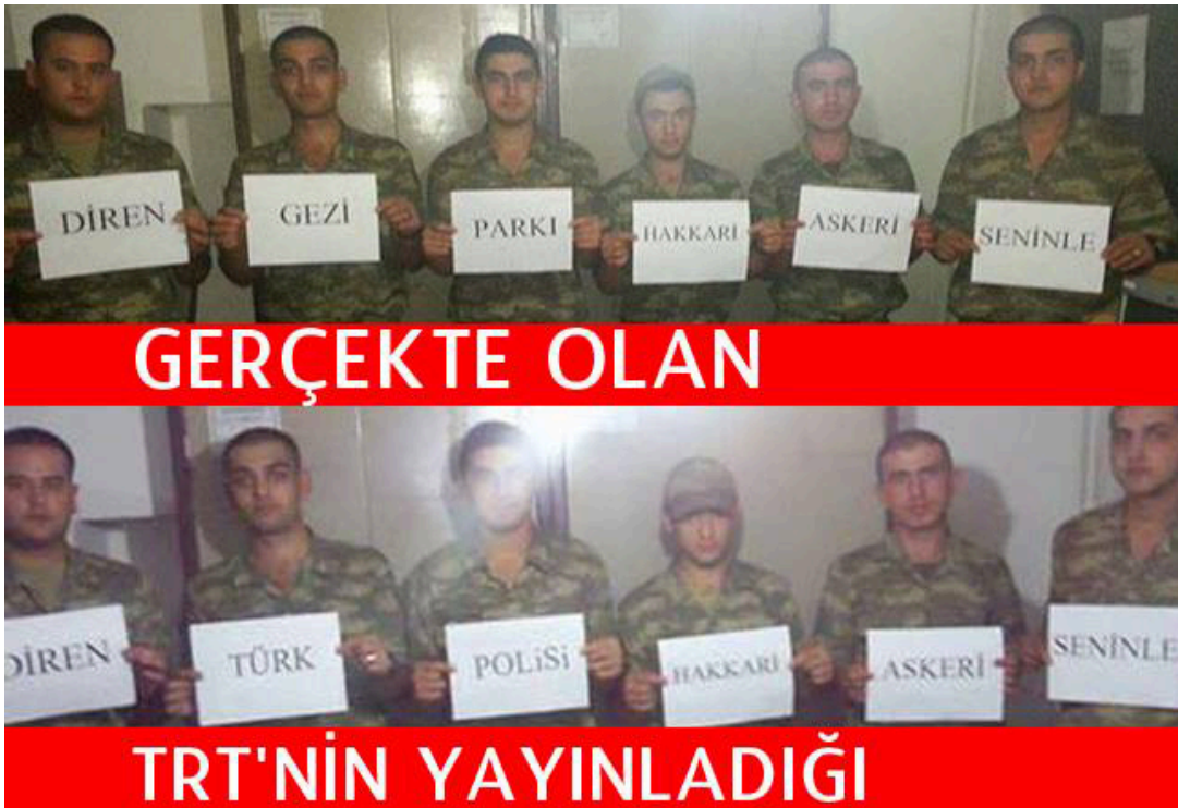
Şekil 3. 20 Gerçekte Olan

Örnek capste biri diğerinin manipülasyonu olarak sunulmuş iki ayrı fotoğraf ve her fotoğraf için betimleyici olan iki ayrı metinsel öge kullanılmıştır. İlk bölümde Gezi Parkı eylemleri sırasında eylemcileri desteklediklerini göstermek için ellerinde 'Diren Gezi Parkı Hakkari Askeri Seninle' cümlesini oluşturan dövizler tutan bir grup asker görülmektedir. Askeri personel eylemler sırasında çektikleri bu fotoğrafı sosyal medya aracılığıyla paylaşmışlardır. İlk bölümdeki fotoğrafın altına capsin oluşturulması sırasında 'GERÇEKTE OLAN' ifadesi yazılmıştır. Capsi oluşturan ikinci görselde de aynı fotoğraf bulunmaktadır. Ancak bu kez askerlerin ellerindeki dövizlerde 'Diren Türk Polisi Hakkari Askeri Seninle' yazmaktadır. Bu fotoğrafta bir öncekinin aksine askerlerin Gezi Parkı eylemcilerini değil polisi destekledikleri görülmektedir.