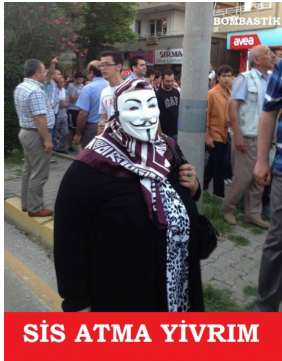
Şekil 3.3 Anonymous Teyze

Örnek caps Gezi Parkı eylemleri sırasında çekilmiş bir fotoğrafın sanal bozuma uğratılmış halidir. Eylemler sırasında paylaşılmış ve dünyaca tanınan dijital aktivist - hacktivist grup Anonymous ile özdeşleşmiş bir maske takan yaşlıca bir kadına ait bu fotoğraf, özellikle sosyal medyada çokça paylaşılmış ve üzerine çokça konuşulmuştur. Sosyal medyada takılan adıyla Anonymous Teyze'nin bu fotoğrafının "SİS ATMA YİVRİM" metniyle birlikte eyleme katılanların temsil ettiği toplumsal gruplara dair analizlere bir katkı yapmaya çalışıldığı görülmektedir. Capse göre eylemler her kesimden insanın katıldığı eylemlerdir. Göstericilere o dönem yöneltilen marjinal gruplar eleştirisinin yersizliğinin gösterilmeye çalışılmıştır. Örnek capsteki yan anlamlardan biri de muhalif kesime yönelik sokağa çağrı yapıldığıdır. Çünkü artık teyzeler bile sokaktadır. Capste fotoğrafın güncel popülerliği ve akıllarda uyandırdığı güçlü etki kullanılarak yine toplumsal bir olaya dair muhalefete hizmet