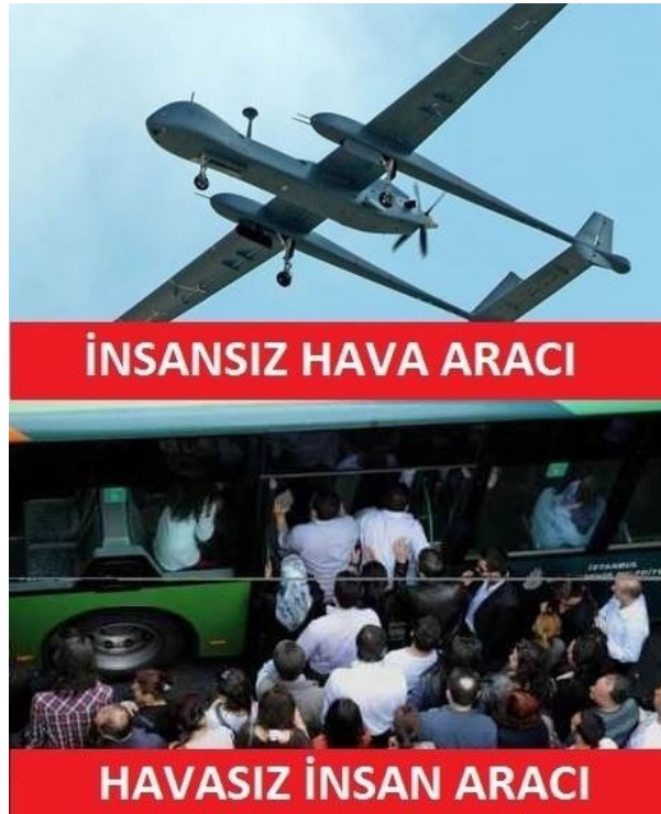
Şekil 3.6 Havasız İnsan Aracı

Örnek caps Türkiye'nin insansız hava araçlarını yoğun olarak tartıştığı bir dönemde sosyal ağlarda çokça paylaşılmıştır. Metinsel öğeler “İNSANSIZ HAVA ARACI” ve “HAVASIZ İNSAN ARACI” ifadelerini taşımaktadırlar. Capste anlam insansız hava aracı adının değiştirilerek bir söz oyunu ile havasız insan aracı şeklinde kurgulanmasıyla örülmüş ve İstanbul'un kalabalıklığıyla ünlü toplu taşıma aracı metrobüslere atfedilmiştir. İnsansız hava araçlarına dair temsili bir fotoğraf ve metrobüslerin kalabalıklığına dair çarpıcı bir fotoğraf yan yana getirilmiştir. Bu noktada caps, hem halkın yaşadığı ulaşım sıkıntısını gündeme getirmeyi amaçlamakta hem de insansız hava uçaklarının ülkenin gündeminde bu kadar yer almasının eleştirisini yapmaya çalışmaktadır. Vatandaşın daha öncelikli sorunları vardır ve bu sorunlar yeterince dillendirilmemektedir. Caps'in güncelin etkinlik gücünü kullanarak göz ardı edilen ya da üzerine yeterince eğilinmeyen somut yaşamsal sorunlara dikkat çekmeye çalışan bir yapıda olduğu değerlendirilebilir. Aynı zamanda caps, iktidarın askeri harcamalara sosyal devletin gerçekleştirmesi gereken hizmetlerden biri olan