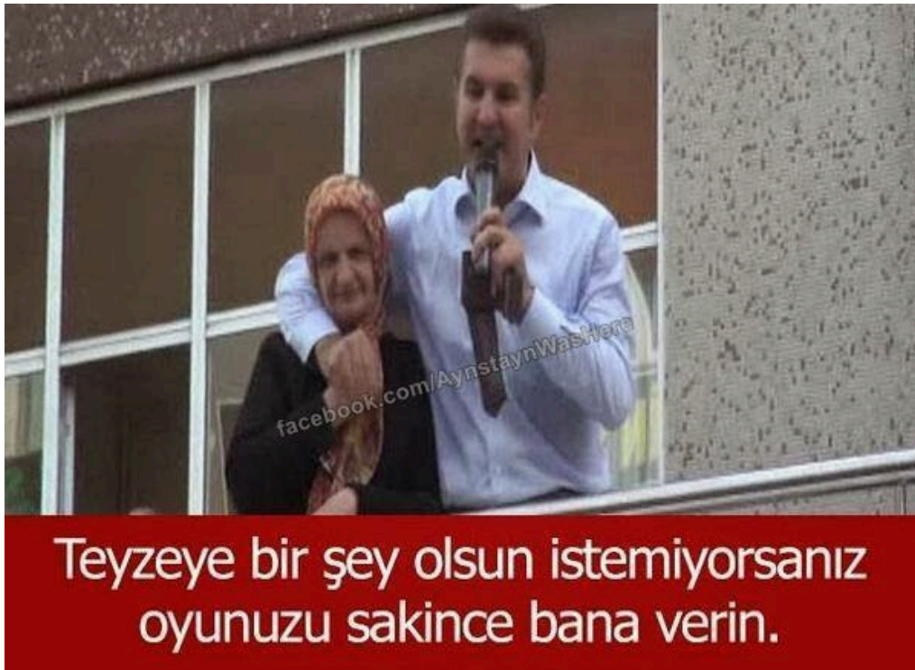
Şekil 3.9 Oyunuzu Sakince Bana Verin

Söz konusu capste yine seçim sürecinde siyasetçilerin seçmenlere yaklaşımı ve seçim yarışı sırasında sürdürölen hoyrat söylem diline dair bir eleřtiri yapılmaktadır. Cumhuriyet Halk Partisi İstanbul Büyükşehir Belediyesi Başkan Adayı Mustafa Sarıgül'ün bir miting sırasında çekilen görüntülerinden yakalanan karede, siyasetçi ve seçmen yan yanadır. Siyasetçinin seçmene sarılarak kitleye hitap ettiđi görölmektedir. Örnek capste yakalanan ve bir seçmenle siyasetçinin yan yana, birlik içinde göröldüđu bir fotoğrafın bozum yoluyla perde arkası gösterilmeye çalışılmıştır. Siyasetçi bozum yoluyla seçmenin sandıđının aksine sadece onun dostuymuş gibi görünen, asıl amacı sadece oy almak olan bir figür olarak gösterilemeye çalışılmıştır. Örnekteki bozum metinsel bir yolla gerçekleştirilmiştir. “Teyzeye bir şey olsun istemiyorsanız, oyunuzu sakince bana verin.” ifadesi özellikle Hollywood sinemasının polisiye örneklerinde sıkça kullanılan “Silahını sakince yere bırak ve teslim ol”