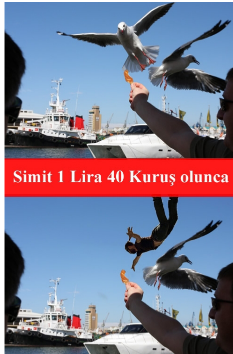
Şekil 3.11 Simit

Örnek caps'te yine vatandaşın güncel sorunlarına dair bir bozum görülmektedir. Türkiye'de yaygın olarak tüketilen ve özellikle dar gelirli kesime dair bir kültürel hinterlanda sahip olan simide yapılan yüzde 40 oranında zammın sosyal medyada sıkça tartışıldığı günlerde siber dünyada paylaşılan bu capste bozum, grafik anlatım üzerinden kurgulanmaktadır. “Simit 1 Lira 40 Kuruş olunca” yazısıyla ikiye bölünen capsin üst kısmında simidin martılara verilebildiği zamdan önceki dönem anlatılırken ikinci bölümde zamdan sonra simidi kapabilmek için adeta martılarla yarışmaya başlayan vatandaşın hali anlatılmaktadır. Zammın dar gelirli vatandaş için vazgeçilmez olan simidi artık zorla elde edilen bir besin kaynağı haline getirdiğini anlatan caps'teki bozum, makro ölçekte de geçim derdinin çözümsüz hale geldiğini, zamların vatandaşın, ekonomik durumun gerçek hali göz ardı edilerek yapıldığını vurgulamaktadır. Bu yolla hükümetin ekonomi politikasına yapılan eleştiri muhalif bir amaçla ortaya konmuştur. Örnek caps aynı zamanda capslerde grafik