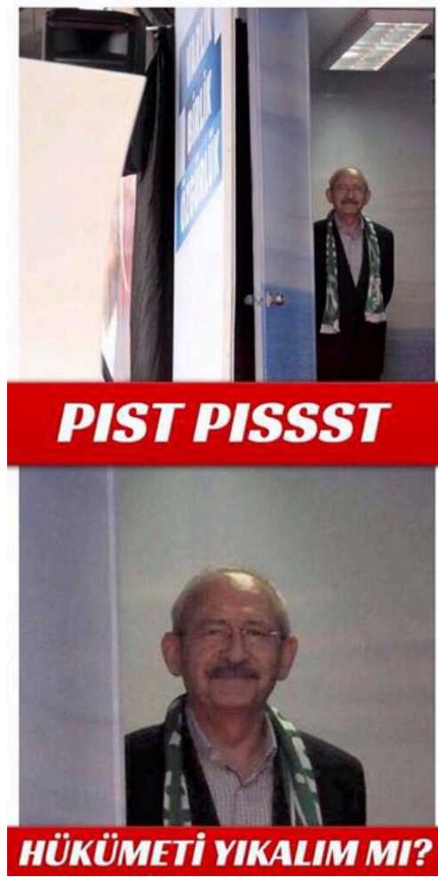
Şekil 3.17 Pıst Pıssst

Örnek capste bozum ana muhalefet partisi Cumhuriyet Halk Partisi'nin Genel Başkanı Kemal Kılıçdaroğlu'nun çekilmiş tek bir fotoğrafının iki farklı kadrada kullanılmasıyla ve metinsel öğeyle verilmiştir. Örnekte kullanılan fotoğraf seçim çalışmaları kapsamında gerçekleştirilen mitinglerden birinde çekilmiştir. Örnekteki metinsel öğede Genel Başkan Kemal Kılıçdaroğlu'nun ağzından "PIST PISSST, HÜKÜMETİ YIKALIM MI?" sözü verilmektedir. Fotoğrafın capsin bağlamından uzak, alakasız bir anlama sahip olmasına rağmen metinle mizahi bir muhalefet eleştirisi ögesi haline getirildiği görülmektedir. Caps'teki eleştiri iki farklı yönde okunabilir. Birincisi CHP lideri Kemal Kılıçdaroğlu'nun muhalefet yapmak, iktidara olgun, kapsamlı bir alternatif oluşturarak başarılı olmak yerine direkt yıkıcı bir tavır ve söylem sürdürmekte olduğu yönündedir. İkincisi ise Kılıçdaroğlu'nun capsteki gayrı ciddi sanal gerçeklikle paralel gayrı ciddi bir muhalefet tarzını benimsediği yönündedir. Capste CHP Genel Başkanı'nın sürece bir oyun gibi baktığı yönünde bir eleştiri yapılmaya çalışılmıştır. Söz konusu örneğin eleştirel, siyasi bir amaçla üretildiği tespitini yapmak mümkündür.