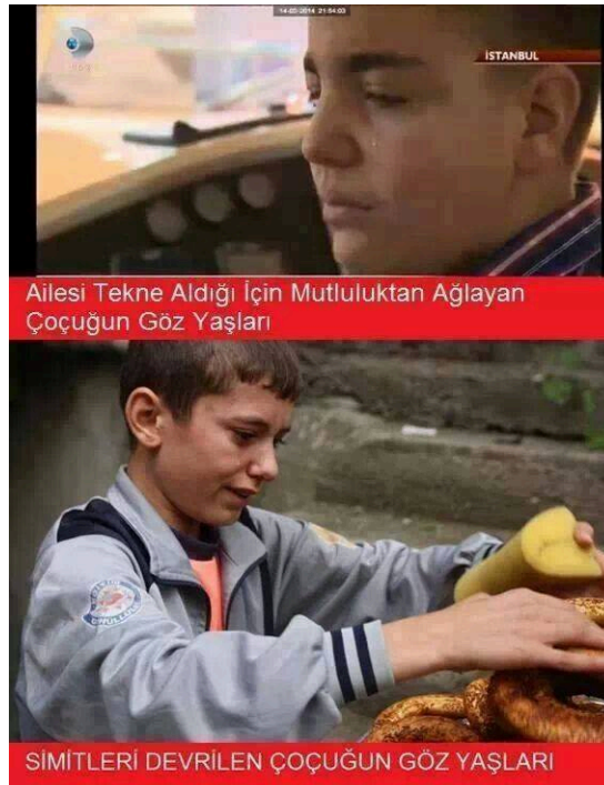
Şekil 3.12 Gözyaşları

Örnek capste iki farklı görselden ve metinden oluşan bir yapı görmekteyiz. Birinci görselde Kanal D televizyonu ana haber bülteninde 18 Şubat 2014 tarihinde yayınlanmış, sosyal medyada o dönem büyük tepki toplayan ve bir erkek çocuğunun ailesinin onun için satın aldığı pahalı bir tekneyi görünce ağlamasını gösteren görüntülü haberden yakalanmış bir görüntü "Ailesi Tekne Aldığı İçin Mutluluktan Ağlayan Çocuğun Göz Yaşları" metniyle birlikte verilmiştir. İkinci görselde ise simit satan benzer yaşlarda bir erkek çocuğunun simitleri devrildiği için ağlarken çekilmiş bir fotoğrafı gösterilmektedir. İkinci görsele dair metinde "SİMİTLERİ DEVRİLEN ÇOCUĞUN GÖZ YAŞLARI" denmektedir. Capste bozum bir ana akım medya kuruluşunun yayınladığı haber üzerinden oluşturulmaya çalışılmış ve Türkiye'deki gelir dağılımı eşitsizliğine dikkat çekmek istemektedir. Yayınlandığı dönemde sosyal medyada yoğun bir şekilde tenkit edilen tekne sahibi olduğu için ağlayan çocuk haberinin dönemsel popülerliğinin gücü yapılan eleştirinin daha çok kişiye ulaşması amacıyla