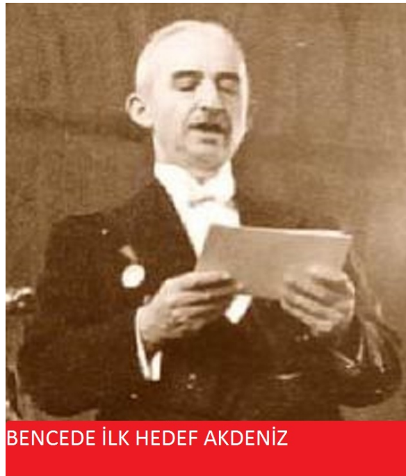
Şekil 3.29 İlk Hedef Akdeniz

Örnek caps tek bir görsel öge ve tek bir metinsel ögeden oluşmaktadır. Görsel öge Türkiye Cumhuriyeti'nin ilk Başbakanı ve ikinci Cumhurbaşkanı İsmet İnönü'nün Türkiye Büyük Millet Meclisi'nde yaptığı bir konuşma esnasında çekilen bir fotoğraftan oluşmaktadır. Metinsel ögede ise "BENCEDE İLK HEDEF AKDENİZ" ifadesine yer verilmiştir. Capste Türkiye Cumhuriyeti'nin kurucusu Mustafa Kemal Atatürk'ün Büyük Taarruz'un başlangıcında, 26 Ağustos 1922'de Türk ordusuna verdiği "Ordular, ilk hedefiniz Akdeniz'dir, ileri" emrine bir gönderme yapılmaktadır. Bu göndermeyle Mustafa Kemal Atatürk'ün yanında Cumhuriyet'in iki numaralı adamı olarak yer alan İsmet İnönü'nün bu gölgede kalma durumuna dair bir tespit yapılmaktadır. Caps'in metinsel ögesi ile Milli Şef'in Atatürk'ün ardından Türkiye'yi yönettiği dönemde onun kadar güçlü ve eşsiz bir liderliği ortaya koyamadığına dair bir anlam kurulmak istenmektedir. İsmet İnönü'nün Mustafa Kemal Atatürk'e kıyasla daha pasif ve onun bıraktığı mirası sadece onaylayan ancak geliştiremeyen