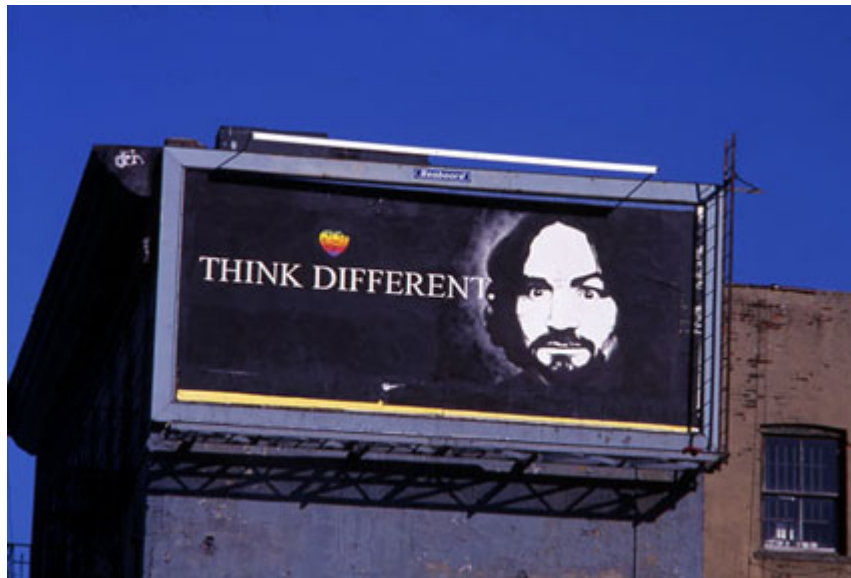
Şekil 1.3 BLF Think Different Kampanyası Bozumu Charles Manson Örneği

Bunun yanında Billboard Liberation Front (BLF) adlı bir diğer kültür bozucu grubun da reklamlardaki metinlerin sadece bir ya da birkaç harfini değiştirerek benzer bir amaca ulaşmak adına çaba göstermektedir. Klein'e göre kültür bozucuların bu eylemlerinin hedefi şirketlerin kendi iletişim metotlarının hacklenerek karşı bir mesaj oluşturulması ve bu yolla birer alıkoyma, önleme durumu yaratılmasıdır. Kültür bozumundaki ironi bunun gerçekleştirilirken şirketlerin kendi kaynaklarının kullanılıyor oluşudur. (Klein, 1999, s.281)