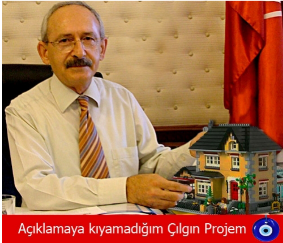
Şekil 3.16 Çılgın Proje

Örnek capste bozum ana muhalefetteki Cumhuriyet Halk Partisi'nin Genel Başkanı Kemal Kılıçdaroğlu'nun bir fotoğrafı, jenerik bir lego ev görseli, bir nazar boncuğu görseli ve metinsel öge ile dört katmanın bir araya getirilmesiyle oluşturulmuştur. Capste muhalefet partisi ve onun genel başkanına yönelik bir siyasi eleştiri yapılmaktadır. Başbakan Recep Tayyip Erdoğan'ın açıkladığı ve çılgın projelerim olarak adlandırdığı Marmaray ve Kanal İstanbul projelerine karşılık olarak CHP liderinin pasif ve üretimsiz kaldığına dair bir tespitin yapıldığı capste Kemal Kılıçdaroğlu'nun çılgın projesi olarak lego'dan bir ev gösterilmektedir. Ayrıca sanki Kemal Kılıçdaroğlu'nun ağzından sarf edilmişçesine 'Açıklamaya kıyamadığım Çılgın Projem' sözü yerleştirilmiştir. Metinsel ögenin sonuna da sarkastik bir şekilde bir nazar boncuğu yerleştirilmiştir. Capste kullanılan CHP lideri fotoğrafı farklı bir amaçla çekilmiş çılgın projeler gündemiyle tamamıyla alakasız bir fotoğraftır. Lego görseli de tamamen ayrı bir kaynaktan elde edilmiştir. Capste birbirinden alakasız üç farklı görsel bir araya getirilmiş ve metinsel ögeyle belirli bir anlama hizmet etmek için bağlanmıştır. Örnekte muhalefetin iktidar karşısında yeterince güçlü projeler üretmediği, CHP lideri Kemal Kılıçdaroğlu'nun da bu anlamda pasif kaldığına yönelik bir eleştiri yapılmaktadır. Aynı zamanda ikincil ölçekte bir iktidar propagandası yapıldığını söylemek de mümkündür. Örnek capsin siyasi ve eleştirel olduğu söylenebilir.