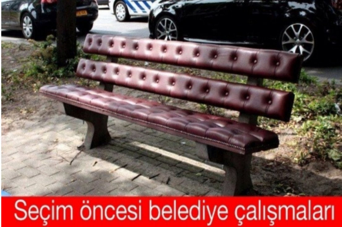
řekil 3.7 Makam Bankı

rnekteki capste tramvay/toplumsal olaylara mdahale aracı rneđindeki gibi benzer bir teknikle bir park bankı makam koltuđu dokusunda gsterilmiřtir. Sıradan insanın oturduđu bank, sıradan olmayan siyasetinin oturduđu makam koltuđuyla i ie geirilmiřtir. Metinsel ge ‘‘Seim ncesi belediye alıřmaları’’ ifadesini tařımaktadır. Capste seim ncesi srelerde siyasilerin halka asla gerek olmayacak vaatlerde bulduklarına dair bir gnderme yapılmaktadır. nk bir park bankının bir makam koltuđu řeklinde gerek hayata grlmesi imknsızdır. Grselde bozumla oluřturulan absrt durum, gerek hayatta da siyasilerin halkla yan yana olmasının absrt olacađına bir gnderme yapmaktadır. Parkta grlen makam koltuđu řeklindeki bir bank ne kadar samaysa siyasilerin halkın yanında olması da o derece sama olacaktır. Byle bir beklenti yersizdir, nk siyasiler siyasi rant elde etmek iin park bankının makam koltuđu gibi gsterildiđi duruma benzer bir řekilde kendilerini halktan gibi gstermektedirler. Aynı zamanda rnek capste seim ncesi yerel lkte belediyelerin oy toplamak iin gstermelik hizmetlerde bulunduđuna dair bir okuma da yapmak mmkndr. Belediyeler seimlerden nceki dnemlerde hizmetlerini artırıp bu řekilde sempati ve oy kazanmaya alıřmaktadırlar. Her iki eleřtiri de makam koltuđu kadar rahat bir park bankının imknsızlıđı ile desteklenmektedir. Bu caps iin de siyasilerin halka