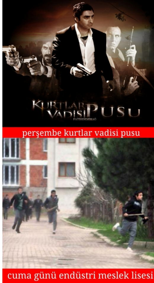
Şekil 3.21 Perşembe - Cuma

Örnek capste iki ayrı görselden üretilmiş ve iki ayrı metinsel öğeyle tamamlanmış bir bozum görmekteyiz. Capsin ilk bölümünde Türkiye'de çok büyük bir hayran kitlesi olan Kurtlar Vadisi Pusu dizisinin bir afişi yer almakta ve ilgili metinde "perşembe kurtlar vadisi pusu" yazmaktadır.