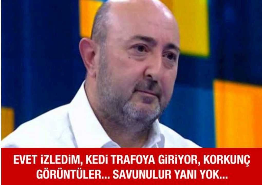
Şekil 3.22 Kedi

Örnek capste Hürriyet Gazetesi yazarı İsmet Berkan'ın bir yakalanmış ekran görüntüsü ve metinsel öge kullanılmıştır. Söz konusu capste yapıyı kuran öge sayısı az olmakla beraber anlamsal aralan çok katmanlıdır. 30 Mart 2014 Yerel Seçimleri sonrasında oy sayımı sırasında yaşanan ve bazı bölgelerde oyların mum ışığında sayılmasına neden olan elektrik kesintileri ile alakalı olarak üretilen caps, aynı zamanda İsmet Berkan'ın Gezi Parkı eylemleri sırasında İstanbul Kabataş'ta belden yukarıları çıplak, ellerinde deri eldivenler, başlarında siyah bandanalar bulunan 80-100 kişilik bir grubun, bebeğiyle birlikte durakta bekleyen bir genç kadını dövdüğü ve üzerine idrarlarını yaptıkları iddiaları üzerine olaya dair mobese kameralarının kayıtlarını izlediğini ve iddiaların gerçek olduğunu söylemesini de eleştirmektedir.