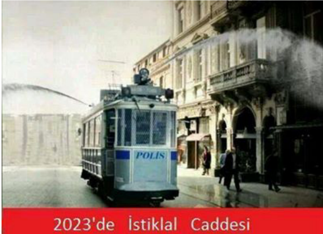
Şekil 3.2 Tramvay TOMA

Örnek capste 28 Mayıs 2013 tarihinde patlak veren, Türkiye siyasetini ve toplumsal hayatını derinden etkileyen Gezi Parkı eylemleri sürecinde yaşanan orantısız polis müdahalelerine dair bir vurgu yapılmaktadır. İstanbul'un sembollerinden İstiklal Caddesi'ndeki bir tramvay toplumsal olaylara müdahale aracı şeklinde gösterilmiştir. Aynı zamanda TOMA kılığındaki bu tramvay etrafta göstericiler olmamasına rağmen iki taraftan su sıkılmaktadır. İstanbul'daki gündelik hayatın sevilen, nostaljik bir unsuru olan tarihi tramvayın bir kolluk kuvveti aracına dönüştürülmesi Türkiye'nin bir polis devleti haline gelmeye başladığı iddiasını ortaya koymaktadır. Gezi Parkı'na son derece yakın olan İstiklal Caddesi'nin mekânsallığı üzerinden gündelik hayatın sıkça siyasi çatışmalarla, kolluk kuvvetlerinin ve protestocuların karşı karşıya gelmesiyle sekteye uğramasına yönelik bir tespit görülmektedir. Klasik bir İstanbul görüntüsünün bozuma uğratıldığı bu capste kullanılan metin de yaratılmak istenen etkiyi güçlü bir şekilde pekiştirmektedir. '2023'de İstiklal Caddesi' ifadesiyle Türkiye Cumhuriyeti'nin 100'üncü kuruluş yıldönümüne vurgu