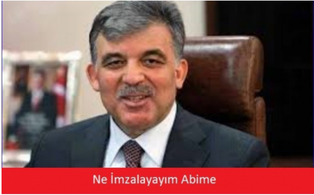
Şekil 3.4 Veto

Söz konusu capsde Cumhurbaşkanı Abdullah Gül'ün grafik anlamda hiçbir müdahaleye uğramamış bir yakalanmış görüntüsü karşımıza çıkmaktadır. Caps Cumhurbaşkanı Abdullah Gül'ün internet erişimini düzenleyici ve toplumun bazı kesimleri tarafından sansür yasası olarak adlandırılan yasayı onaması üzerine üretilmiş ve paylaşılmıştır. Bu örnekte bozum iki yoldan yapılmıştır. Birincisi ve ön planda olan metindir. 'Ne İmzalayayım Abime' metinsel ögesiyle Cumhurbaşkanı'nın TBMM'de yapılan yasal düzenlemeleri onama yetkisine gönderme yapılmaktadır. Metinde Cumhurbaşkanı Abdullah Gül'ün hükümetin Köşk'e gönderdiği her yasayı tereddütsüz onayladığına dair bir gönderme vardır. İkinci olarak Gül, pozitif bir ruh hali içinde gösterilmiştir. Bu yolla örnekte ortaya konan Cumhurbaşkanı'nın görev tanımına dair tarafsızlık ilkesini ihlal ettiği iddiası, kendi durumdan memnun görüntüsüyle kanıtlanır hale getirilmeye çalışılmaktadır. Capsde devletin en üst seviyedeki görevlisi olan Cumhurbaşkanı'nın bazı yetkilerini sorgulamadan, hükümetle olan ortak siyasi geçmişine bağlı kalarak ve halkın demokratik taleplerini göz ardı ederek kullandığına dair bir iddia söz konusudur. Bu bağlamda caps, Cumhurbaşkanı Abdullah Gül'ün icraatlarına