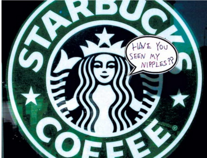
Şekil 1.2 Bubble Project Starbucks Örneği

Bunun yanında Billboard Liberation Front (BLF) adlı bir diğer kültür bozucu grubun da reklamlardaki metinlerin sadece bir ya da birkaç harfini değiştirerek benzer bir amaca ulaşmak adına çaba göstermektedir. Klein'e göre kültür bozucuların bu eylemlerinin hedefi şirketlerin kendi iletişim metotlarının hacklenerek karşı bir mesaj oluşturulması ve bu yolla birer alıkoyma, önleme durumu yaratılmasıdır. Kültür bozumundaki ironi bunun gerçekleştirilirken şirketlerin kendi kaynaklarının kullanılıyor oluşudur. (Klein, 1999, s.281)