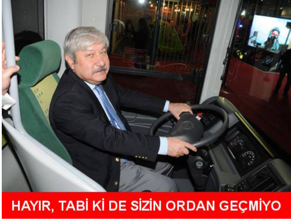
Şekil 3.14 Tabi Ki De