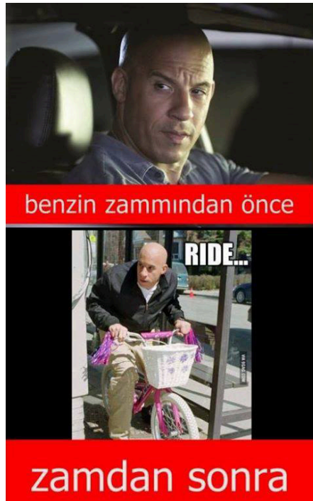
Şekil 3.5 Zam

Türkiye'de üretilen ve siber dünyada paylaşılan capsler konularını sadece siyasi liderler veya olaylardan almamaktadırlar. Capslerin çokça üretildikleri bir diğer alan da gündelik hayata dair geçim sıkıntısı, işsizlik, ulaşım gibi konulardır. Söz konusu caps gündelik hayatı direkt olarak etkileyen bir zam haberine istinaden oluşturulmuştur. 'benzin zammından önce' ve 'zamdan sonra' metinlerinin yer aldığı capste Hollywood yıldızı Mark Sinclair Vincent'in iki ayrı fotoğrafı kullanılmıştır. Genellikle güçlü, maço ve eninde sonunda kazanan aksiyon filmi karakterlerini canlandıran Vincent'in ikinci fotoğrafta bir çocuk bisikletine biner halde gösterilmesi vatandaşın zamdan sonra düştüğü durumla örtüştürülmüştür. Burada çocuk bisikletine binmiş aktörün durumu alegori ile vatandaşın benzin zammından sonra düşen yaşam kalitesini gösteren bir görsele dönüştürülmüştür.