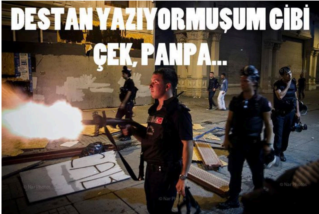
Şekil 3.27 Destan

Örnek caps bir adet görsel ve bir adet de metinsel öğeden oluşmaktadır. Gezi Parkı eylemleri sırasında bir grup çevik kuvvet polisinin eylemcilere müdahale ederken çekilmiş fotoğrafı ve "DESTAN YAZIYORMUŞUM GİBİ ÇEK, PANPA..." ifadesine taşıyan bir metinden oluşmaktadır. Capste eylemler sonrasında 24 Haziran 2013'te Başbakan Recep Tayyip Erdoğan'ın polisin eylemcilere müdahale ederken takındığı tutumla ilgili olarak