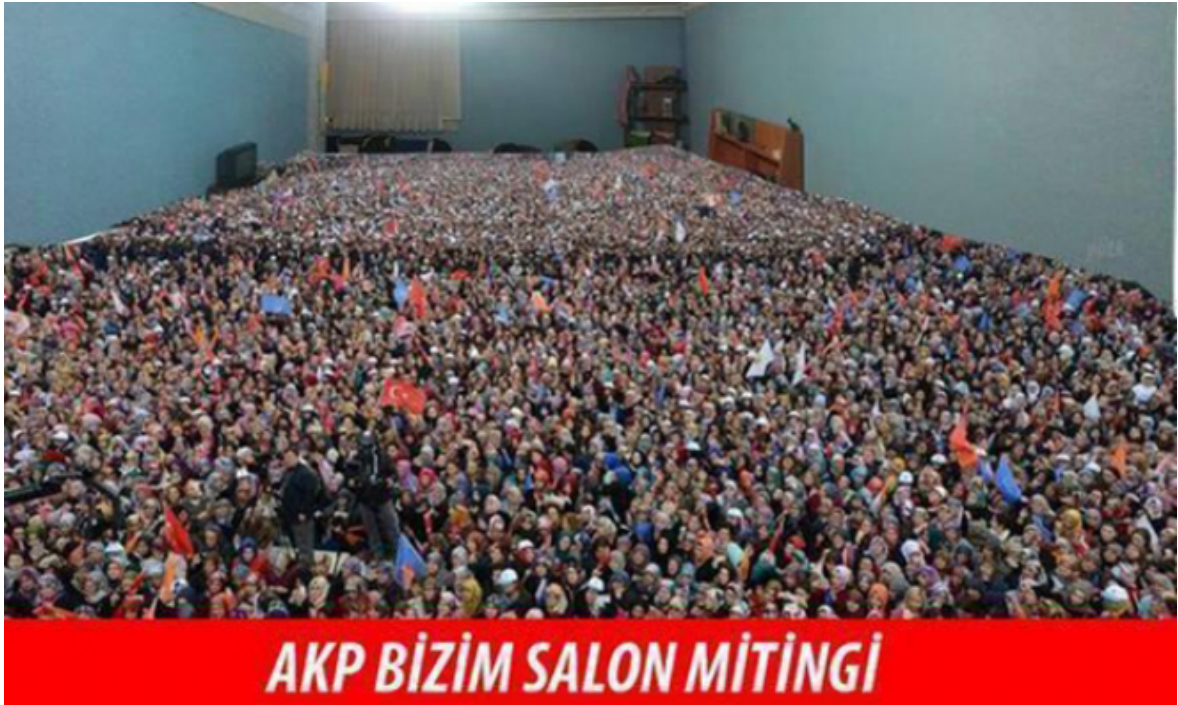
Şekil 3.18 Bizim Salon

Örnek capste bozum siyasal gündeme yönelik üç katmanlı bir şekilde elde edilmektedir. İktidardaki Adalet ve Kalkınma Partisi'nin 30 Mart 2014 Yerel Seçimleri öncesi gerçekleştirdiği mitinglerdeki fotoğrafların dijital manipülasyona uğratıldığına ve mitinglerde toplanan insanların gerçekten daha kalabalık gösterildiğine dair medyada yer alan iddialar üzerine üretilmiş capste, mitinglerden elde edilmiş bir yakalanmış görüntü, bir oda görseli ve metinsel öge kullanılmıştır. Capste Adalet ve Kalkınma Partisi mitinglerinden alınmış bir görüntü, anonim bir oda fotoğrafının üzerine bindirilmiş ve "AKP BİZİM SALON MİTİNGİ" metnine yer verilmiştir. Bu yolla iktidar partisinin medya tarafından servis edilen miting fotoğraflarının manipülasyona uğratıldığı ve kamuoyunun yanıltıldığı anlatılmak istenmiştir. Bozumda absürtlüğün dikkat çekici gücü ve gündemin dikkat çekiciliği kullanılarak bariz bir şekilde gerçek olamayacak bir temsili miting görseli elde edilmiştir. Aynı absürtlük metindeki 'BİZİM SALON' ifadesiyle de pekiştirilmiştir. Örnek cap'te hem kamuoyunu doğru bilgilendirmekle yükümlü medyaya yönelik bir eleştiri hem de söz konusu manipülasyona neden olan iktidardaki Adalet ve Kalkınma Partisi'ne yönelik muhalif bir tavır gözlemlenmektedir. Capsin siyasi, eleştirel ve muhalif bir amaçla üretildiği söylenebilir.