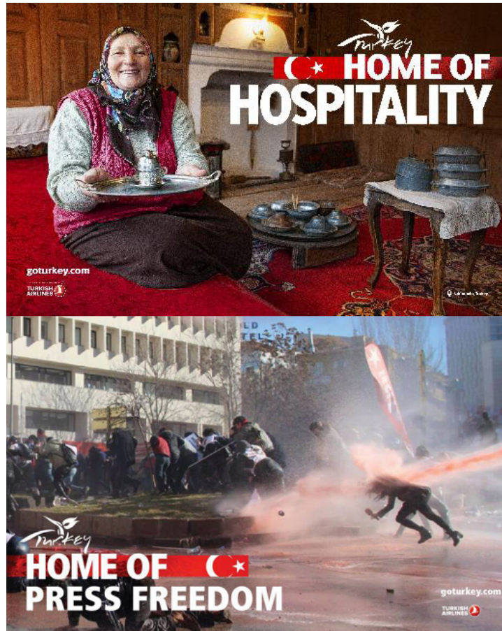
Şekil 3.25 Basın Özgürlüğünün Yuvası

Örnek capste tek bir görsel öge ve üç farklı metinsel öge kullanılmıştır. Capste 13 Şubat 2014 tarihinde Ankara'da Türkiye Gençlik Birliği tarafından düzenlenen bir eylemde çekilen bir fotoğraf kullanılmıştır. Özel yetkili mahkemelerin kaldırılmasını öngören yasanın getirdiği tutukluluk sürelerinin beş yıla indirilmesi uygulamasının Ergenekon ve Balyoz