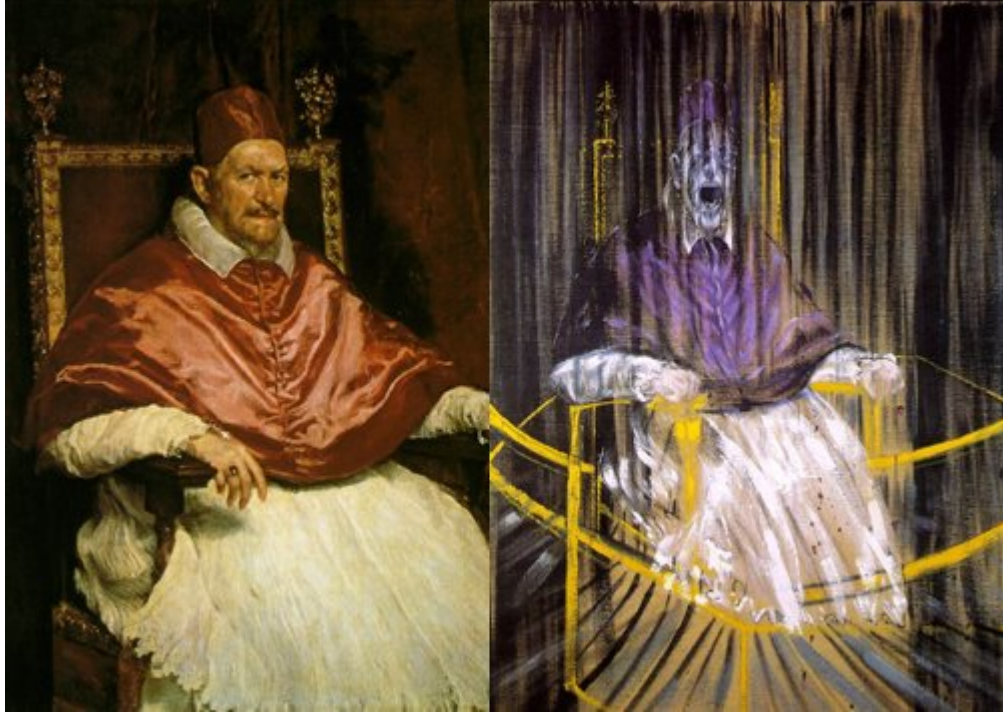
Şekil 1.1 Bir Detournement Örneği Olarak Papa X. Innocentius

Kültür bozumu da günümüzde büyük yoğunlukla sanatsal / yaratıcı işler üzerinden kendisini devam ettirmektedir. Bu bağlamda da Debord'un detournement anlayışıyla kültür bozumcuların bakış açısı örtüşmektedir. Debord'un kültür bozumunun temel teorisi detournement adına ortaya koyduğu eleştirdiği gösteri toplumu olarak nitelediği toplumsallaşma sürecine dairdir. Debord'a göre (1996, s.14) gösteri ve imaj, modern toplumların tüm yaşamını kapsar. Ona göre gösteri artık bir toplumsal ilişkiler bütünüdür. Gösteri, toplumun bir parçası olarak, özellikle, bütün bakış ve bilinçleri bir araya getiren sektördür.