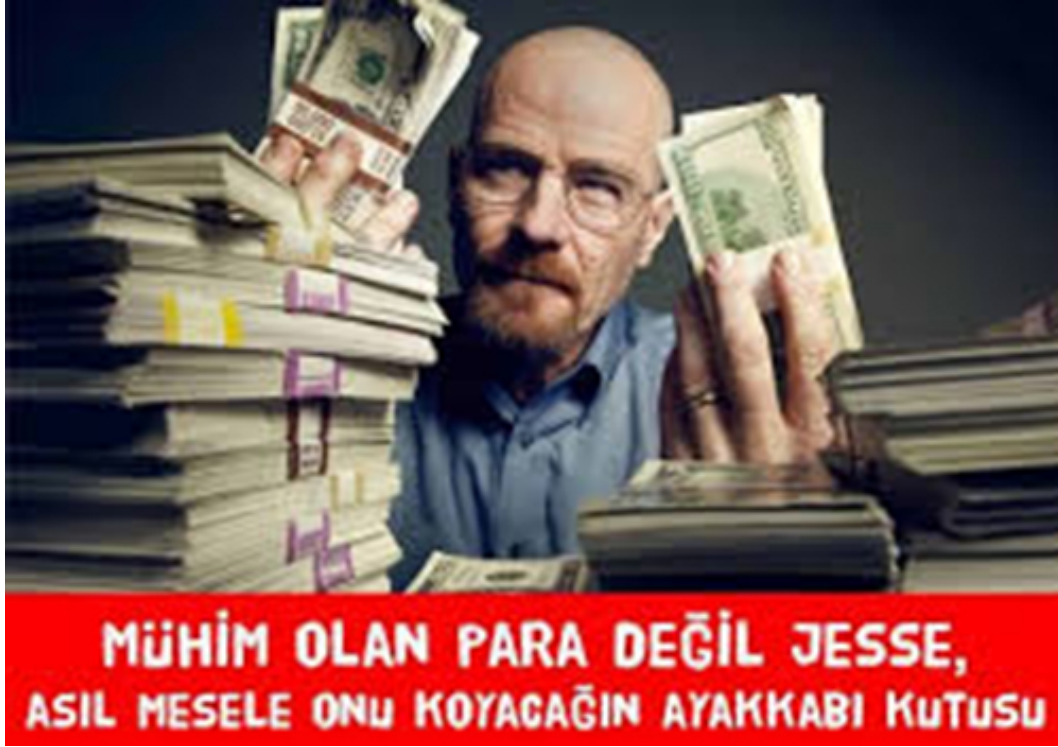
Şekil 3.15 Ayakkabı Kutusu

Örnek caps 17 Aralık Rüşvet ve Yolsuzluk Operasyonu'nun Türkiye gündemini meşgul ettiği günlerde üretilen ve paylaşılan bir capstir. Burada bozum dünyaca ünlü televizyon dizisi Breaking Bad'in başkarakteri Walter White'in diziden yakalanmış bir görüntüsü üzerinden kurgulanmıştır. Walter White özetle para kazanmak ve güç elde etmek için tüm insani değerlerini kaybetmeyi göze almış bir karakter olarak tanınmaktadır. Capste karakter yine dizideki baş karakterlerden olan yardımcısı Jesse'ye seslenmektedir. Ancak bu sesleniş Türkiye'nin gündemindeki 17 Aralık operasyonuna dair bir gönderme içermektedir. Caps'teki metinsel öge operasyon sırasında Halk Bankası Genel Müdürü Süleyman Aslan'ın evinde polis tarafından bulunan ayakkabı kutularına saklanmış paralara dair bir gönderme yaparak "MÜHİM OLAN PARA DEĞİL JESSE, ASIL MESELE ONU KOYACAĞIN AYAKKABI KUTUSU" demektedir. Örnekteki bozum dünya çapında milyonlarca kişi tarafından izlenen bir televizyon işinin başkarakterinin tanınırlığı ve imajı üzerinden gerçekleştirilmiştir. Metinsel öge de eleştirel bağlamı tamamlamaktadır. Türkiye'deki rüşvet ve yolsuzluk operasyonuna yönelik bir durum tespiti ve eleştiri gerçekleştirilmektedir. Bu bağlamda capsin Türkiye'nin gündemine ilişkin yaşanan ve siyasi tabanı da olan bir sürece eleştirel bir bakışla değindiği söylenebilir.