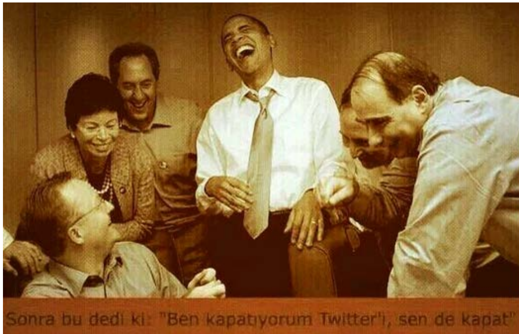
Şekil 3.28 Twitter

Örnek capste tek bir görsel öge ve tek bir metinsel öge kullanılmıştır. Görsel öge Amerika Birleşik Devletleri Başkanı Barack Obama ve yakın çalışma arkadaşlarının seçim galibiyeti sonrası çektiikleri bir fotoğraftan oluşmaktadır. Metinsel ögede ise "Sonra bu dedi ki: 'Ben kapatıyorum Twitter'ı, sen de kapat'" ifadesi yer almaktadır. Caps 21 Mart 2014'te Twitter adlı sosyal ağa erişimin Türkiye'de mahkeme kararıyla engellenmesi üzerine üretilmiş ve erişilebilen sosyal ağlarda sıkça paylaşılmıştır. Barack Obama ve çalışma arkadaşlarının gülerken görüldüğü fotoğraf gerçekte hiçbir alakası olmamasına rağmen Türkiye'deki Twitter