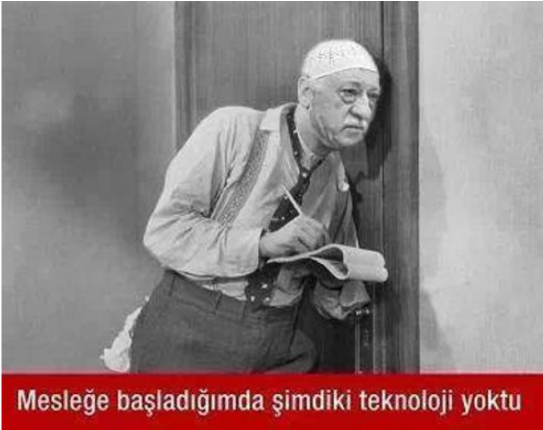
Şekil 3.19 Meslek

Örnek capste bozum iki katmanlı bir görsel çalışma ve metinsel öğeyle yapılmıştır. Caps 17 Aralık yolsuzluk ve rüşvet operasyonu başladıktan sonra ortaya çıkan ve gerçek olduğu iddia edilen ses kayıtlarına dair bir durum tespiti yapmaya çalışmaktadır. Kamuoyunda operasyonun perde arkasında Gülen Cemaati - Adalet ve Kalkınma Partisi çatışmasının olduğu yönündeki eğilime uygun bir gerçekliğin kurgulandığı bu örnekte bir kapının arkasını dinleyen birinin gösterildiği bir fotoğrafa Gülen Cemaati Lideri Fethullah Gülen'in başı yüzü yerleştirilmiş ve metinsel öğede de "Mesleğe başladığımda şimdiki teknoloji yoktu" denmiştir. Capste Fethullah Gülen'in mesleğinin yasadışı dinleme yapmak olduğuna ve bu yolla güç elde ettiğine dair bir tespit yapılmaktadır. Bu bağlamda rüşvet ve yolsuzluk operasyonu sonrasında ortaya çıkan ve gerçek oldukları iddia edilen ses kayıtlarının bizzat Fethullah Gülen'in emriyle siber dünyaya salındığı ve Fethullah Gülen Cemaati'nin uzun zamandır gizli / yasadışı dinleme yaptığına dair bir sanal gerçeklik caps yoluyla siber dünyayla paylaşılmıştır. Örnek capsin güncel siyasete dair bir tavır ortaya koyduğu ve gerçekliği iddia edilen ses kayıtlarının elde edilme yöntemini demokratik haklar çerçevesinde eleştirdiği söylenebilir. Caps, eleştirel ve siyasidir.