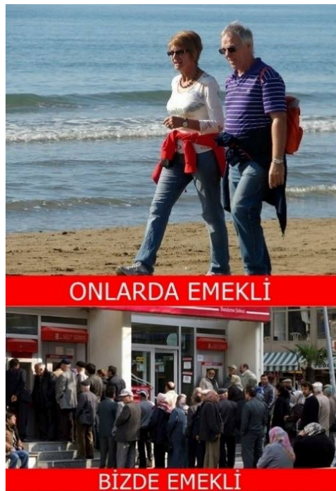
Şekil 3.13 Emekli

Örnek capste jenerik iki görsel kullanımı yoluyla Türkiye'nin sosyal bir sorununa yönelik eleştirel bir mesaj verilmeye çalışılmaktadır. Birinci görselde emeklilik çağında olabilecek iki batılının mutlu bir şekilde deniz kenarında yürüdükleri görülmektedir. Çift tatil yaparken gösterilmekte ve metin olarak da "ONLARDA EMEKLİ" ifadesi kullanılmaktadır. Capsi oluşturan ikinci görselde ise Türkiye'den pek de yabancı olmadığımız bir durumu anlatan bir fotoğraf kullanılmıştır. İlk görseldeki emekli çiftle aynı yaşta pek çok insan bir bankanın önünde maaş kuyruğunda beklemektedir. Bu bölümde kullanılan metinsel öge de "BİZDE EMEKLİ"dir. Capste Türkiye'deki emeklilerle batılı emekliler arasındaki ekonomik statü farklılığına ve Türkiye'nin sosyal devlet olarak vatandaşlarına emekliliklerinde gereken refahı sağlayamadığına dair bir tespit yapılmaktadır. Batılı emekliler tatil yaparken Türkiye'dekiler maaş kuyruğunda beklemektedirler. Örnek capste verilmek istenen mesaj iki birbirinden bağımsız fotoğrafın metinsel bağlamda birbirlerine zıtlık inşa edecek şekilde bir