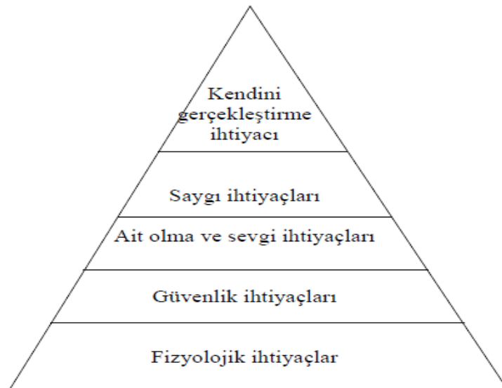
Şekil 1.2 Maslow'un İhtiyaçlar Hiyerarşisi Piramidi (Karapınar, 2008)

Maslow 'Kendini Gerçekleştirme' kavramını öne sürerek, uygun ortam olduğunda her insanın gizil güçlerinin farkına varacağını ve kendini gerçekleştireceğini savunmaktadır. Maslow sağlıklı bir kişiliğin gelişebilmesi için gerekli olan gereksinmelerin oluşturduğu piramit biçiminde bir hiyerarşiden bahsetmektedir. Gereksinimler bir piramit gibi birbiri üstüne merdiven basamağı şeklinde çıkan hiyerarşik bir düzen içinde sıralanmıştır. Temeldeki bir gereksinme karşılanmadan, birey daha üstte yer alan gereksinimlerden etkilenmez alt düzeydekiler belirli bir düzeyde doyuma oluşunca, üst düzeye hazır hale gelmektedir. Görüleceği gibi alt düzeydeki ihtiyaçlar yaşamımızda daha çok yer kapsamaktadır (Ersanlı ve diğerleri, 2004).