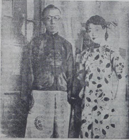
Mançuri hükümeti reisi ilan edilen sabık Çin imparatoru Puyi ve zevcesi

Şanghayda yeni ve çok şiddetli bir harp başlıyor