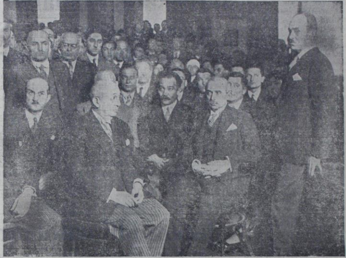
Halkevinin kışat resminde hazır bulunan başvekil İsmet paşa Hz. ile sihiye vekil Refik bey ve diğer zevattan bir kısmı

(Halkevinin açılına resmine ait tafsilât dördüncü sahifemizde).