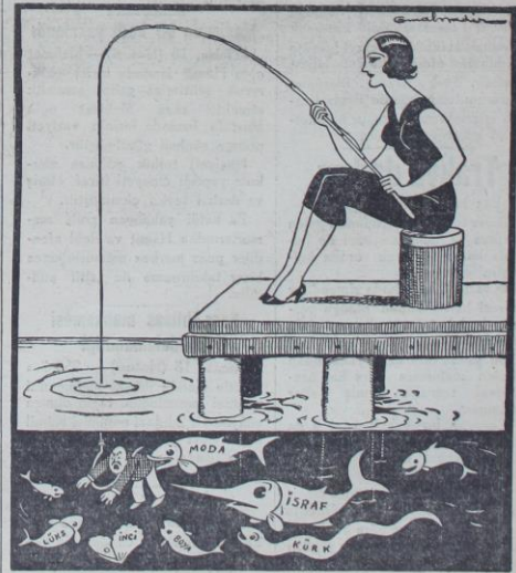
Kadın - Erkek mesclisi I.

için, vapurculara tebliğat yapılmış- tır ve müddet dolduğu zaman, gümrük idaresi, tabii enval kanunu myıcince, hareket etmeğe mevcur olacaktır. Evvelce de yazdığımız gibi, bu- günkü deniz ticaretinin gümrük resmi ehemmiyetli bir mesele değildir. Vapurculuğu inkişafını temin etmek için, başka sebepler ve çarçer aranmak lâzımdır. (Devamı ikinci sahifede)