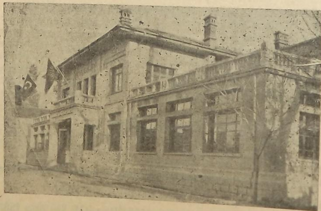
İnşaatı biten Halkevimiz