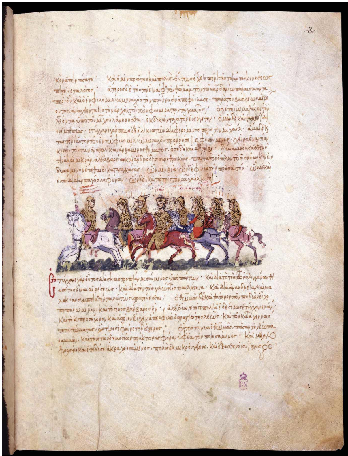
Kaynak: Skylitzes El Yazması Madrid Ulusal Kütüphanesi.