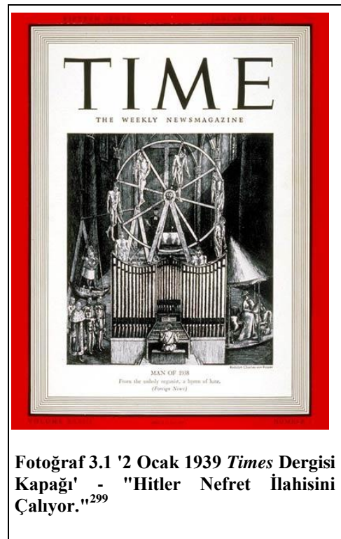
Fotoğraf 3.1 '2 Ocak 1939 Times Dergisi Kapağı' - "Hitler Nefret İlahisini Çalıyor." 299

Nitekim, zorlu ve inatçı kişiliğinin yanında, sanatsal yetenekleri olan ve milliyetçilik konusunda keskin çizgileri olan Hitler, bir ulusu da adım adım kendisiyle birlikte bir yokoluşa