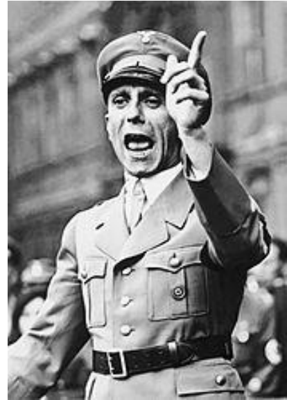
Fotoğraf 3.9 349 Ekim 1934'te Berlin'de Konuşma Yapan Joseph Goebbels.

Resimde görüldüğü üzere, Goebbels'in 1934 yılının Ekim ayında Berlin'de yaptığı konuşmada jest ve mimikleri ile kullandığı beden diline oldukça hakim olduğu da bilinmektedir. Kimi zaman bir düşmanı işaret edercesine işaret ettiği parmağı ve kimi zaman da elleri cebinde, otoritenin kimde olduğunu göstermişcesine konuşmasıyla birlikte Hitler kadar Goebbels de kitleleri etkileme hünerine sahip olduğunu kanıtlamıştır. Hitler'in birçok konuşmasını da kaleme alan, onun karakterini kuvvetli bir biçimde göstermesini sağlayan yine Goebbels olmuştur. Aynı şekilde Goebbels'in de Hitler tarafından beğenilme arzusu taşıdığı ve yazdığı bir çok konuşmasının