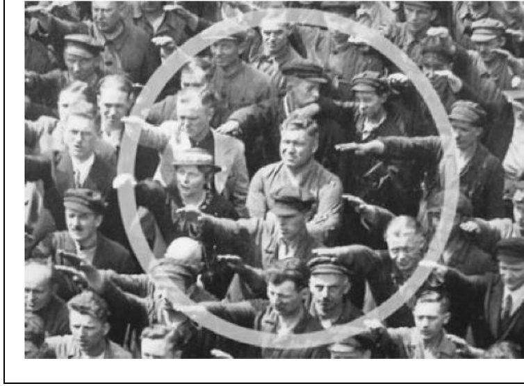
Fotoğraf 3.10: 13 Haziran 1936, Tershanede Gemi İşçisi Olarak Çalışan August Landmesser Nazi Selamı Vermeyi Reddediyor. Limanda Yeni Gemi "Horst Wessel" in Denize İndirilmesi Üzerine, Adolf Hitler'in Onuruna Yardımcısı Rudolf Hess Konuşmacı Olarak Bulunmakta. 362

Kendisini ünlü yapan ve pasif direnişin simgesi olarak görülmesine yol açan "Hitler selamını vermeyi reddedip kollarını önünde bağlama" hareketini, 1936 yılındaki yeni bir geminin denize indirilmesi sırasında Adolf Hitler'in onuruna konuşma yapan yardımcısı Rudolf Hess'in önünde yapmıştır. Muhtemelen o sırada fotoğraf çekileceğini bilmemektedir.