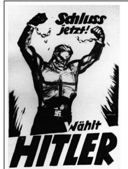
Fotoğraf 2.3 Mart 1932, Başkanlık Seçimleri Afişi. "Artık Yeter! Hitler'i Seçin" 224