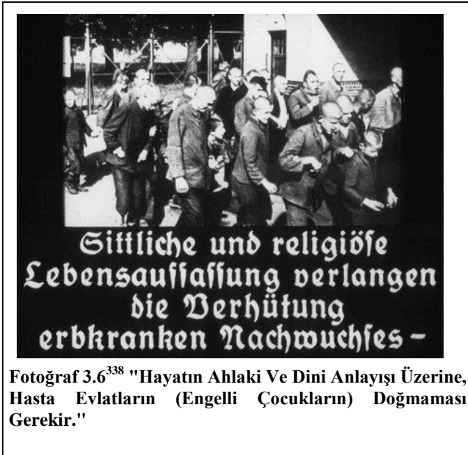
Fotoğraf 3.6 338 "Hayatın Ahlaki Ve Dini Anlayışı Üzerine, Hasta Evlatların (Engelli Çocukların) Doğmaması Gerekir."

açığının belirten fotoğraf, ırkçı yaklaşımlar konusunda Nazi Hükümeti'nin duruşunu kanıtlar niteliktedir.