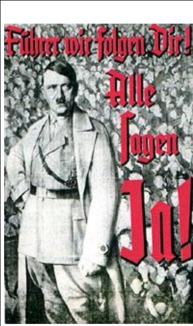
Fotoğraf 2.2 "Hitler Seni İzleriz! Herkes Evet Diyor!" (1934) 222

1933 yılında seçimi kazanan Nazi Partisi'nin kutlamaları, sıradan bir sevinme eyleminden de öte, "Eski Almanya"ya, yani Weimar Cumhuriyetine karşı da büyük bir öfke gösterisine dönüşmüştü. Nazi Partisi tarafından, Versailles Barış Antlaşması'nı kabul eden ve Alman ulusuna ihanet eden olarak görülen Weimar Cumhuriyeti'nin devri kapanmakta ve güçlü bir yeni Almanya doğmaktaydı. Bu nedenle seçim sonrasında üç gün boyunca hem imparatorluk hem de Nazi bayrakları göndere çekilmiş ve bayraklar dalgalanmış, geçit törenleri yapılmış, eski Weimar Cumhuriyeti bayrağı yakılmıştır. 223 Bir yıl önceki başkanlık seçimlerinde kullanılan propaganda posterlerinden biri de Weimar Cumhuriyeti'nin Almanlar'ı zincire vurduğu yönünde vurgu yapmaktaydı.