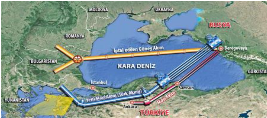
Tablo 2.3 Türk Akımı Projesi.