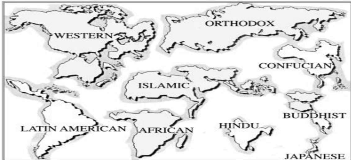
Tablo 1.2 Huntington'un Dünyası

Huntington, 1993 yılında yayınladığı makalesinde Medeniyetler Çatışması Tezini ortaya koymuştur. 73 Soğuk savaş döneminde, Batı, Doğu ve üçüncü dünya ülkeleri şeklinde olan bölünmenin, Soğuk savaşın bitmesiyle son bulduğunu artık ülkelerin kültür ve medeniyetleri kapsamında tanımlanması ve sınıflandırılması gerektiğinin önemi üzerinde durmuştur. 74 Huntington'a göre medeniyet kimliği gelecek yıllarda giderek önemi artacak ve değer kazanacak, yaklaşık olarak yedi veya sekiz medeniyet arasında şekillenecektir. 75 Bu medeniyetler; Batı, Japon, Konfüçyüs, İslam, Hint, Latin Amerika, Slav-Ortodoks ve Afrika medeniyetleri olacaktır. 76