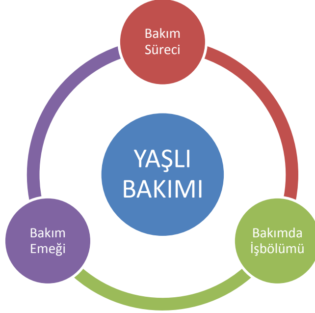
Şekil 4.1. Yaşlı bakımının bileşenleri

Bu bölümde yaşlı bakımı konusu ekseninde bakım süreci, bakımda işbölümü ve bakım emeği konuları ele alınmaktadır.