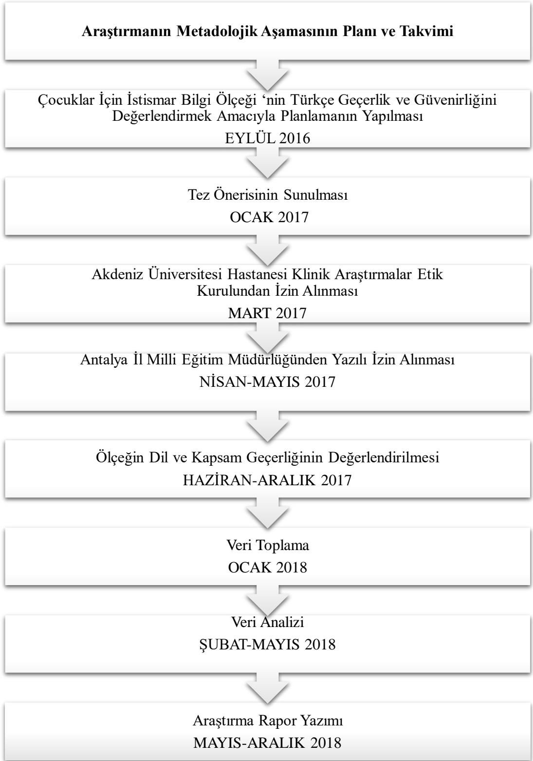
Şekil 3.1. Araştırma uygulama süreci