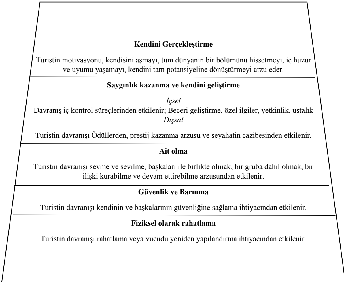
Şekil 2.1 Seyahat Kariyer Merdiveni