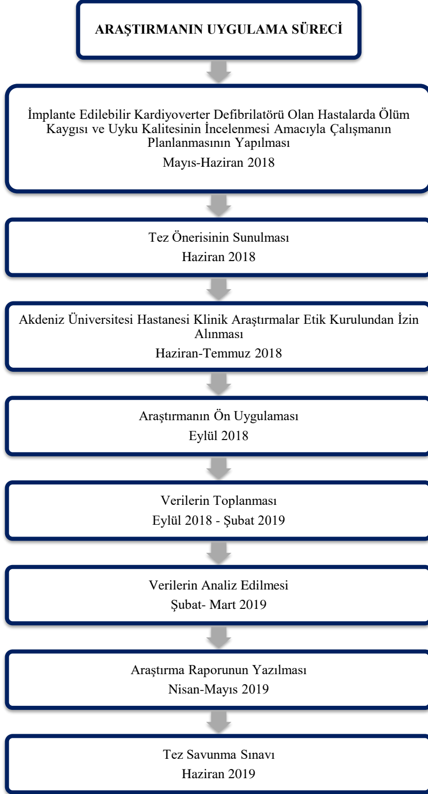
Şekil 3.1. Araştırmanın Uygulama Süreci