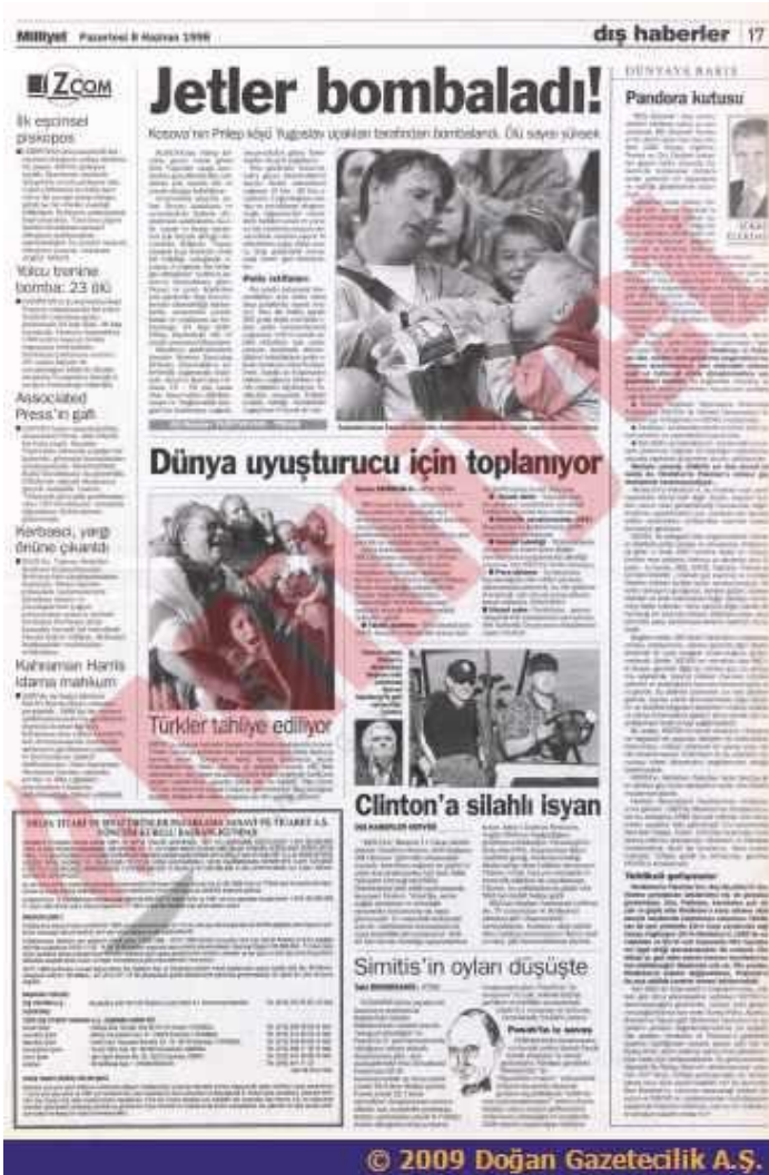
Görsel 3.5 “Jetler Bombaladı” 612