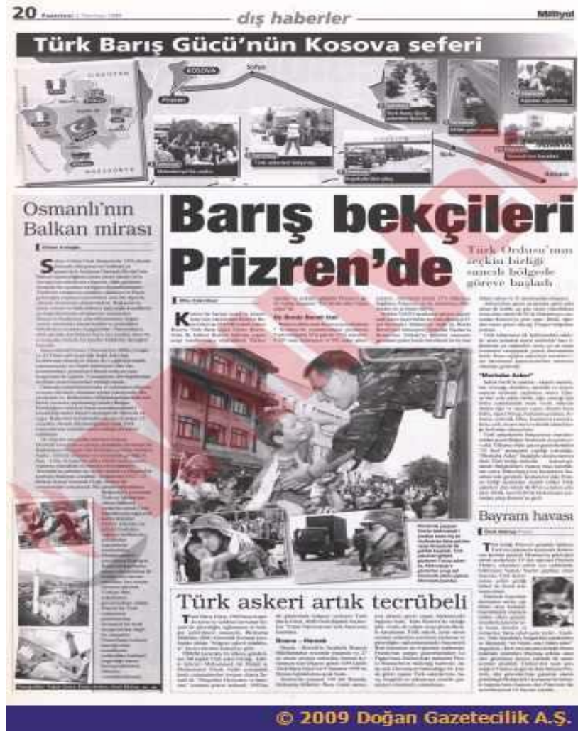
Görsel 3.7 Barış Bekçileri Prizren'de 622

Bu noktaya kadar Türkiye'nin Kosova konusundaki tutumunu değiştiren parametrelere değindik, Kosova sorunu sırasında NATO operasyonuna giden dönemde Türkiye'nin kırmızı çizgisi olan "başka ülkenin toprak bütünlüğüne saygı" ilkesinin sosyal inşacılık çerçevesinde değişebildiğini gördük. Bu değişim, Wendt ve Onuf'un kurallar ve normların insanların etkisiyle(kamuoyu baskısı)değişip devlet tarafından çıkarlarına göre(NATO etkisi ve bölgede nüfuz kazanma) yeniden yorumlanabileceği iddiasını haklı çıkarmaktadır. Türkiye devleti bu süreçte hem kamuoyunu yönlendirmiş hem de kamuoyunun yönlendirmesi ile dış politikasını yeniden inşa etmiştir. Örneğin, Kosova'daki Müslüman ve özellikle Türk azınlık konusu ön plana çıkarılarak Kosova müdahalesi 'kutsal mili dava' inşasının bir yapı taşı olarak kullanılabilmiştir.