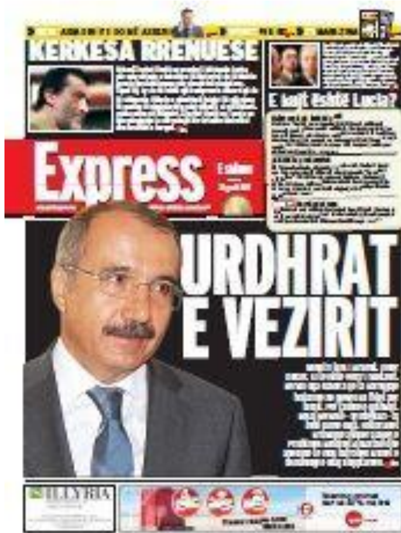
Görsel 3.9 “Vezirin Emirleri” 709