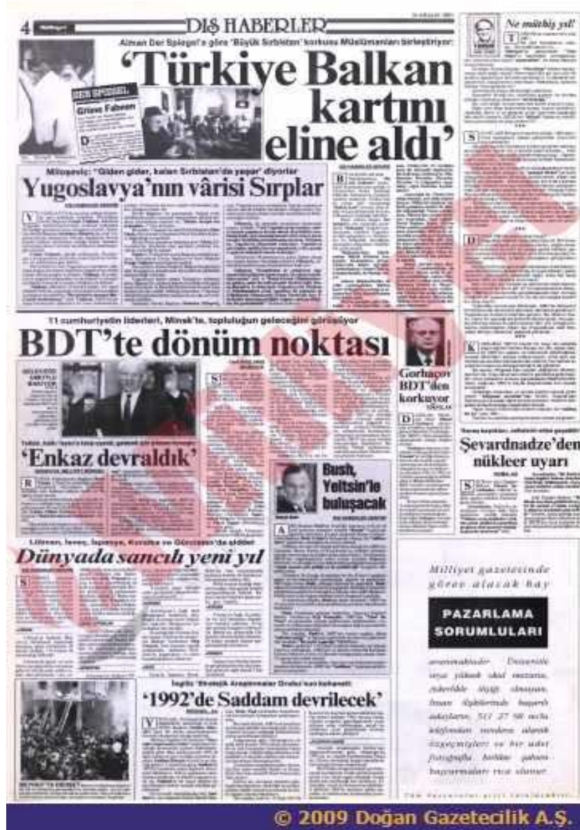
Görsel 3.1 “Türkiye Balkan Kartını Eline Aldı” 600

Soğuk Savaş sonrası Balkanlar’da yaşananlar Türk medyasında yer bulmaya başlamış ve Özal’ın “Adriyatik’ten Çin Seddi’ne” söylemine uygun haberler işlenmeye başlanmıştı. (bkz: Görsel 3.1) Yugoslavya’nın dağılması sürecinde Özal, 23 Ocak 1992’de hem Yugoslavya Devlet Başkanı Miloseviç’i hem de Arnavutluk Dış İşleri Bakanı İtir Voçka’yı Ankara’da ağırlamış ve görüşlerini almıştır. Türkiye’nin toprak bütünlüğünü savunan pozisyonda bulunuyor olması Miloseviç tarafından övgü almış ve bu haber Milliyet’te “Ankara’nın Politikasına Övgü” başlığı ile yer almıştır. 601 Kosova sorununda Kosova Arnavutları ile Türkiye’nin ilk resmi teması 1992’de gerçekleşmiştir. Kosova’nın bağımsızlığı için mücadele eden ve bağımsızlık sonrası Kosova Cumhurbaşkanı olacak olan İbrahim