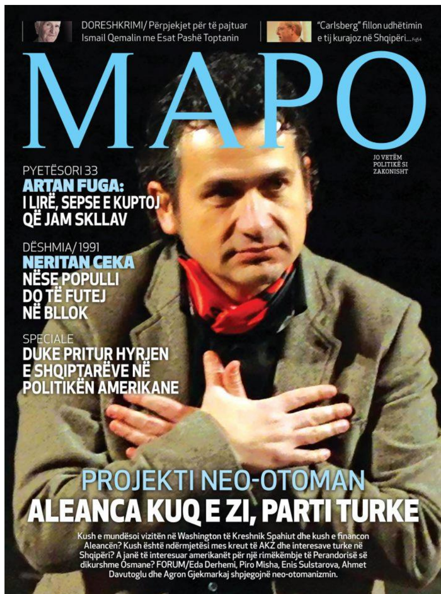
Görsel 3.12 “Yeni Osmanlı Projesi” 757

Misha'nın görüşlerine bir destek de Tiran Üniversitesi Medeniyetler tarihi bölümünden Agron Gjekmarkaj'dan gelmiştir. Gjekmarkaj, “Yeni Osmanlıcılık” kavramını “boş hayallerin limanı” olarak tanımlamaktadır. Gjekmarkaj, ayrıca bu hayale kapılan Arnavutları da üstü kapalı olarak “vatan hainliği” ile suçlamaktadır. Yani, bu görüşü benimseyenler, yüzyıllar önce Arnavutlar ve Hristiyanlar için savaşan İskender Bey'e karşı savaşan Arnavut Osmanlı Paşaları gibidir. Yani bu kişiler, İskender Bey'in kardeşi olmasına rağmen İskender Bey'e karşı Osmanlı tarafında yer alan Hamza Kastrioti ve İskender Bey'e karşı savaşan Balaban Paşa gibi davranmaktadırlar. Gjekmarkaj da Misha'ya benzer bir şekilde Arnavutların önünde bir tercih olduğunu belirtmektedir. Yani, Arnavutlar ya “demokrasi”, “özgürlük” ve “insan hakları” gibi değerleri olan Avrupa yoluna girecekler ya