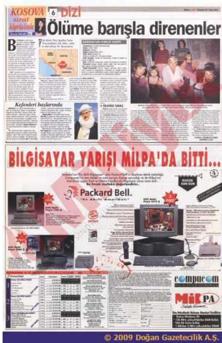
Görsel 3.3 “Ölüme Barışla Direnenler” 609

1998 yılı ise Kosova meselesinde en keskin dönemecin girilen yıl olmuştur. Örneğin bağımsızlığı Arnavutluk dışında tanınmayan Kosova'nın o dönemki Dışişleri Bakanı Edita'nın İstanbul'da Kosova için Dünya'ya yardım çağrısında bulunmuş ve bu çağrı Milliyet gazetesinin ana sayfasında yer almıştır. 610 1998 yılında Kosova Kurtuluş Ordusu(UÇK) ve Sırbistan Ordusu arasındaki çatışmaların şiddetlenmesi ve bölgeden gelen soykırım iddiaları karşısında Türk dış politika yapıcılarını ABD'nin de tarafını belli etmesi ile içeriden gelen baskıya dayanamayı Kosova üzerine daha aktif bir politika izlemeye başlamıştır. (bkz: Görsel 3.4) Bu dönem neredeyse her gün Kosova'daki katliam ile ilgili haberler gazete ve