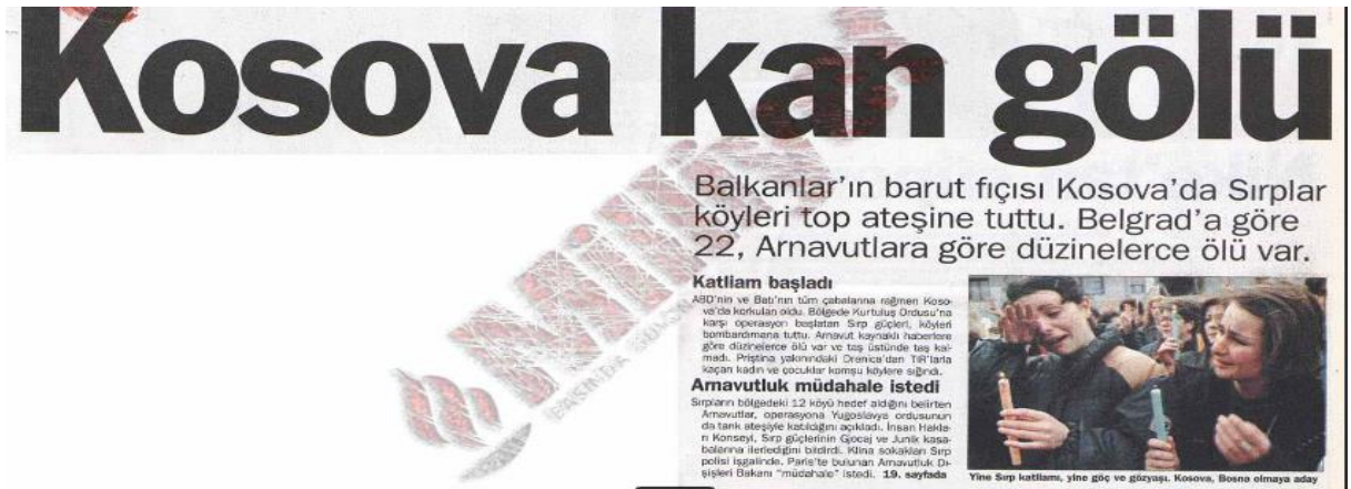
Görsel 3.4 “Kosova Kan Gölü” 611

televizyonlarda yer bulmakta, medya aracılığı ile kamuoyu oluşturulmaktaydı. (bkz: Görsel 3.5)