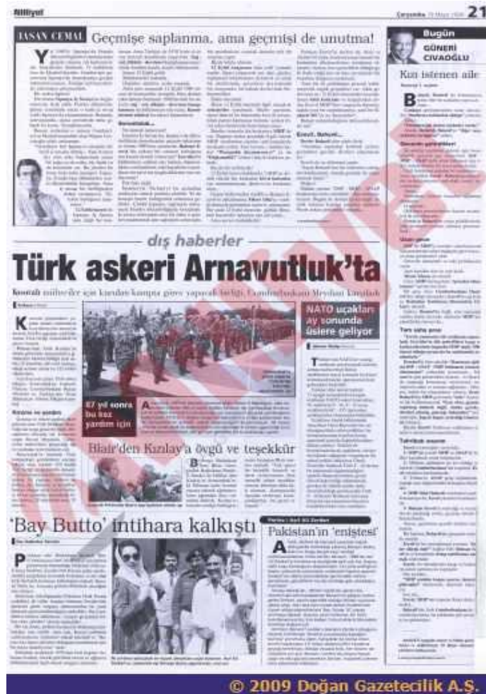
Görsel 3.8 "Türk Askeri Arnavutluk'ta" 623

NATO'nun Belgrad müdahalesi ile Sırp lar geri çekilene kadar asıl tartışma Kosovalı mültecilerin durumu olmuşt u. Mültecilerin birçoğu Arnavutluk ve Makedonya'ya sığınmış ve Türkiye de gönüllü olarak birçok mülteciyi kabul etmişti. Asıl mülteci yoğunluğu ise Arnavutluk'taydı ve Elbasan şehrinde NATO bünyesinde insani yardımların koordinasyonu için kurulan AFOR'a (Albanian Force) Türkiye, İzmir Foça'dan 400 kişilik bir birlik yollamıştı. Birliği Arnavutluk Cumhurbaşkanı Recep Meidani karşılamıştır. Bu durum Kosova konusunda Türkiye'nin aldığı tutumun Arnavutluk tarafından ne kadar olumlu bulunduğunu göstergesidir. Bu birliğin basında "87 yıl sonra bu kez yardım için" gibi cümlelerle geçmişe atıf yapılarak duyurulması dikkat çekicidir. (Bkz:Görsel 3.8).