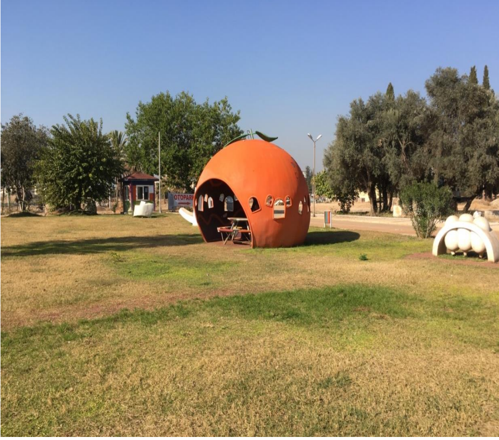
Dokuma Parkı