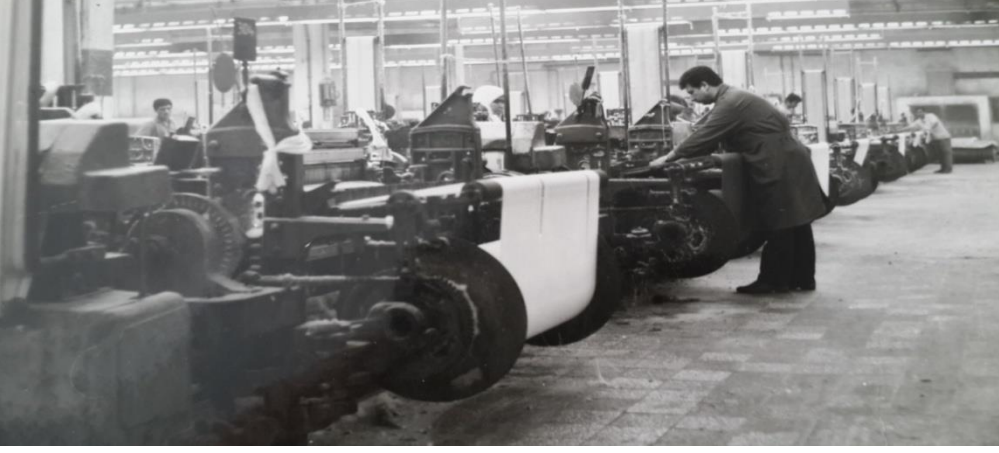
Fabrikanın İşletme Bölümü