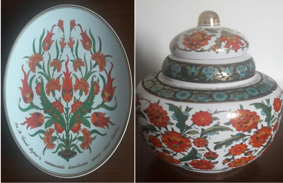
Sümerbank'ın Fabrikadan emekli memurlara verdiği çini hediye