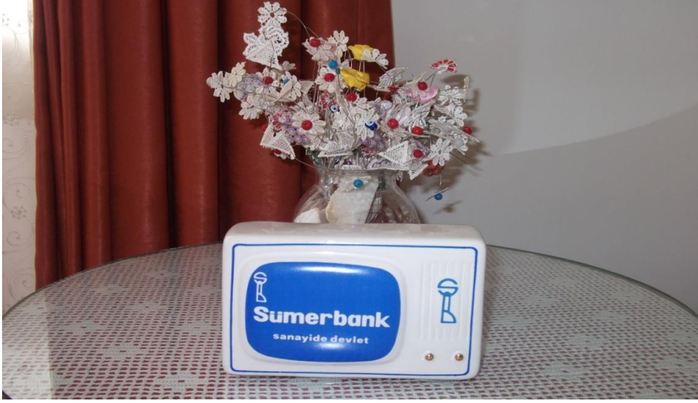
Sümerbank Kumbara