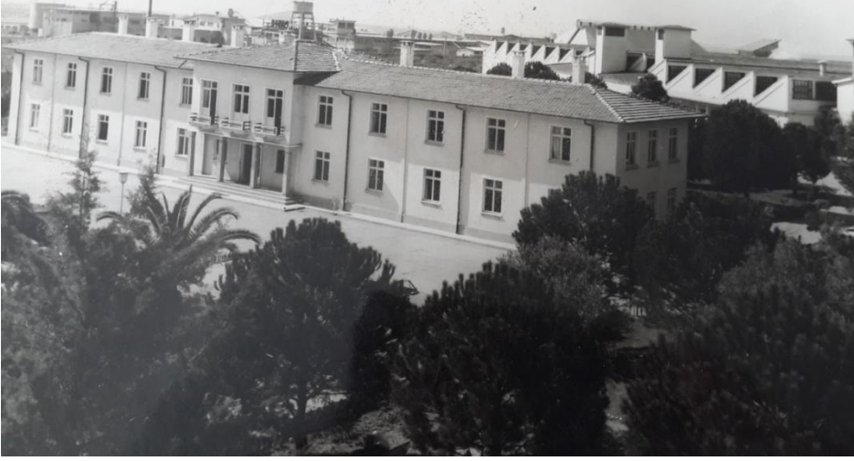
Dokuma Fabrikası