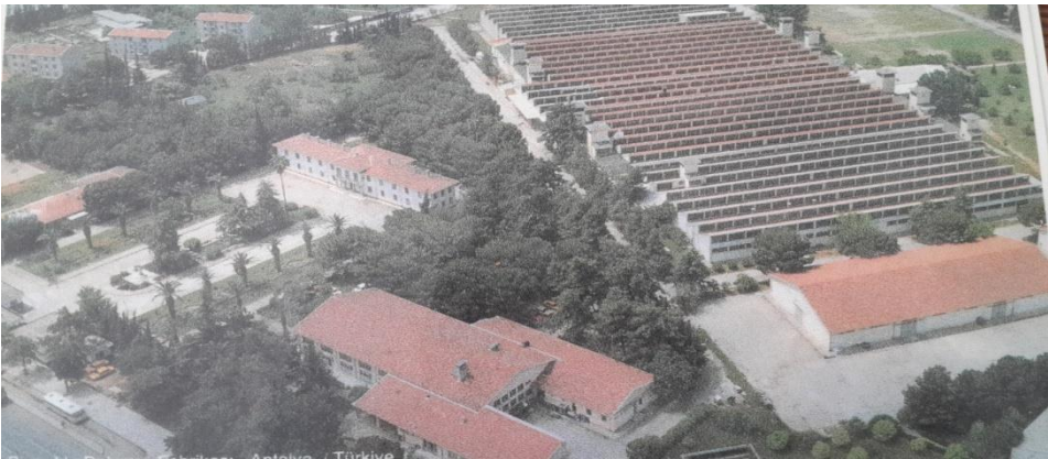
Fabrikanın Kuş Bakışı Görünümü