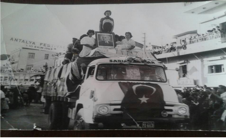
Antalya Festivali