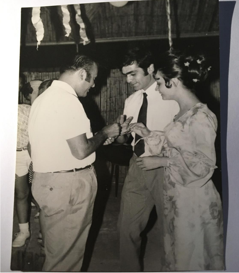
Dokuma Fabrikası'nda bir nişan töreni (Şeyda Hanım Arşivi)