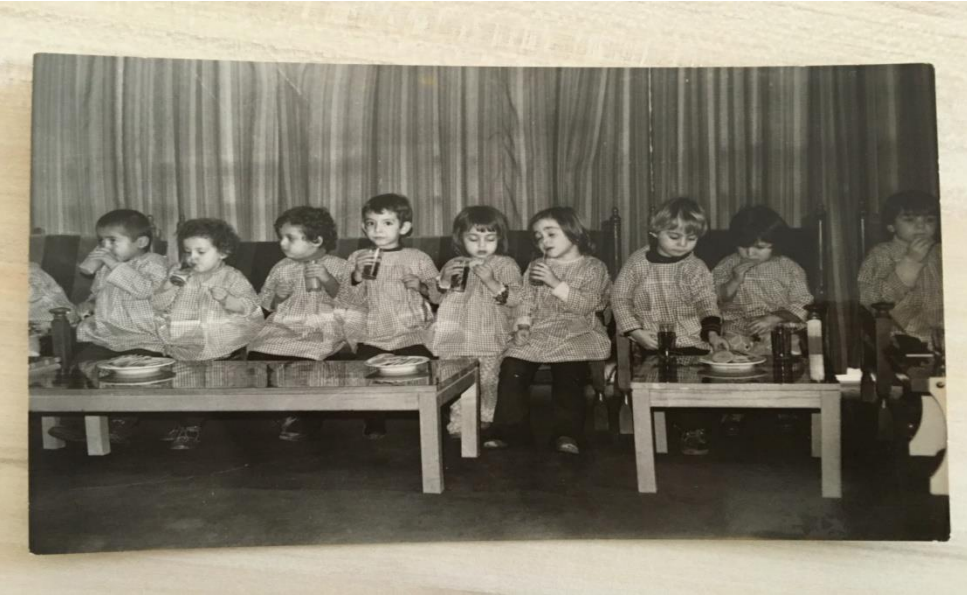
Dokuma Kreşi