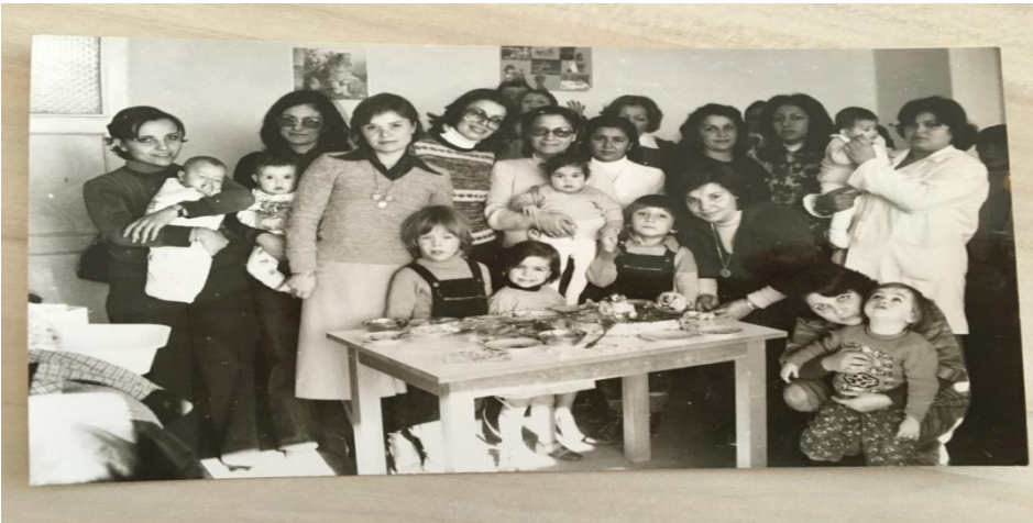
Dokuma Lojmanı Sakinleri