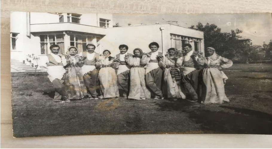
Dokuma Folklor Ekibi (Şeyda Hanım Arşivi)