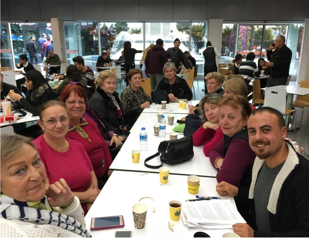
Fabrikadan emekli olan kadınlar