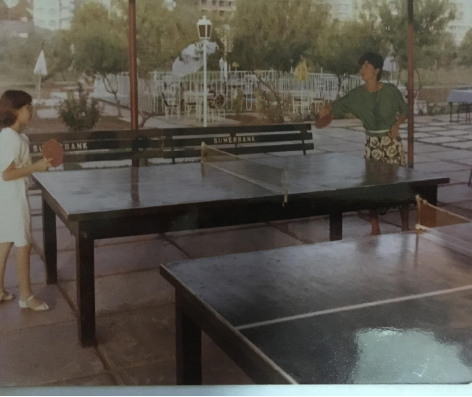
Dokuma'da pinpon oynayan çocuklar