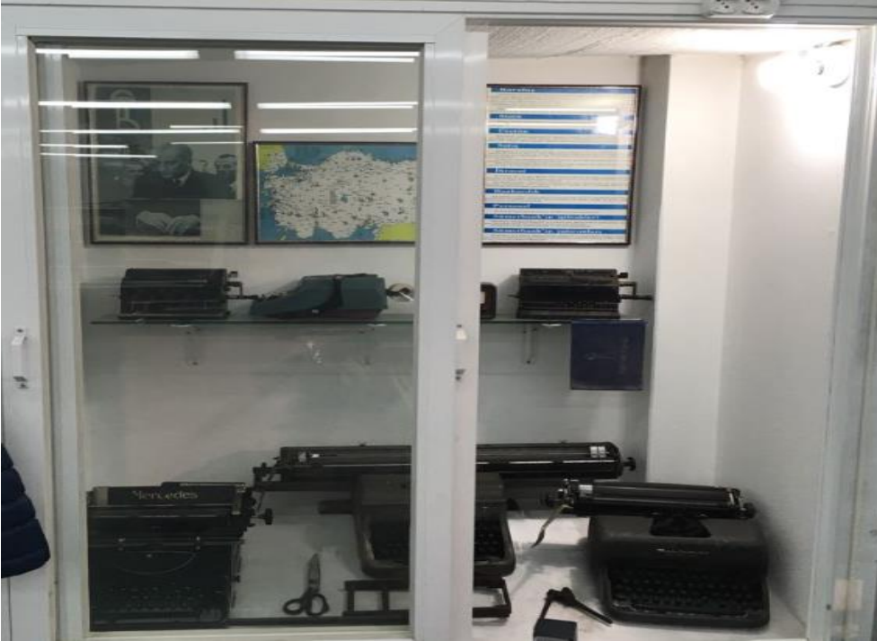
Antalya Sümerbank Satış Mağazası, Sümerbank Köşesi