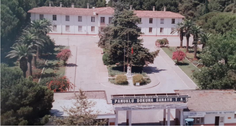
Dokuma Fabrikası (Halil Tezcan Arşivi)