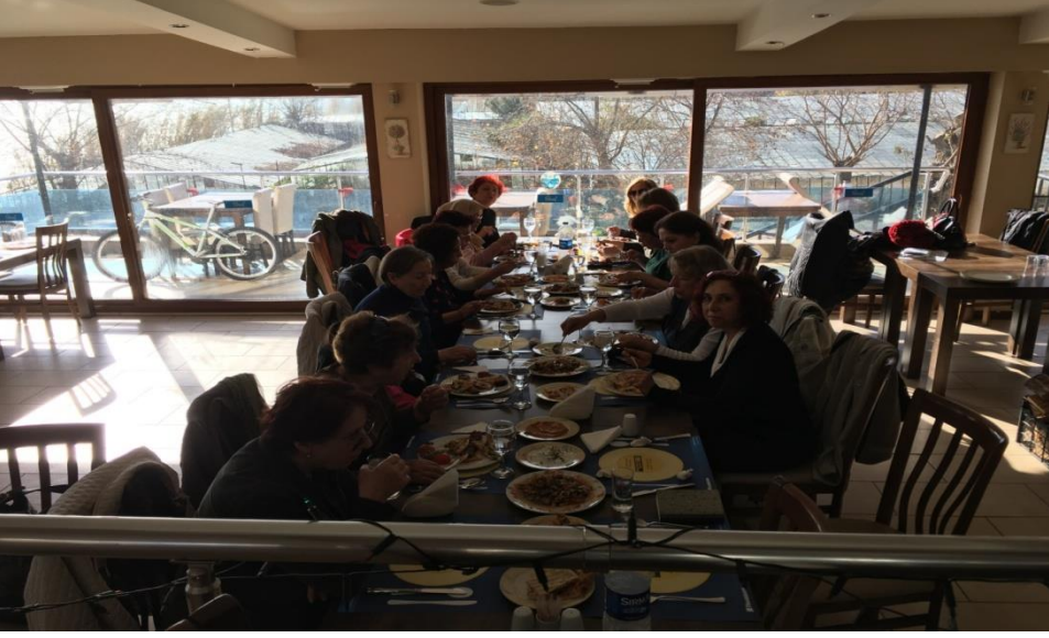
Emekli Kadımları “Gün” Etkinlikleri (07.01.2017)