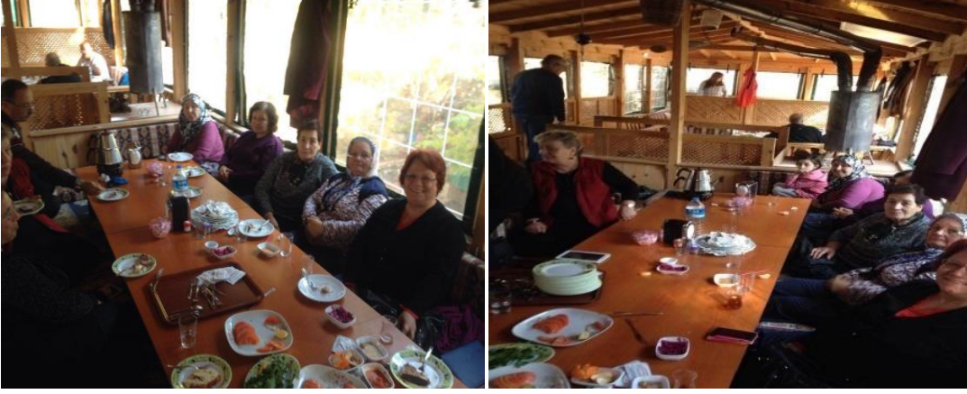
Fabrikadan Emekli Olan Katılımcıların Çakırlar Mevkiinde Düzenledikleri Kahvaltı Etkinliği 24.12.2015