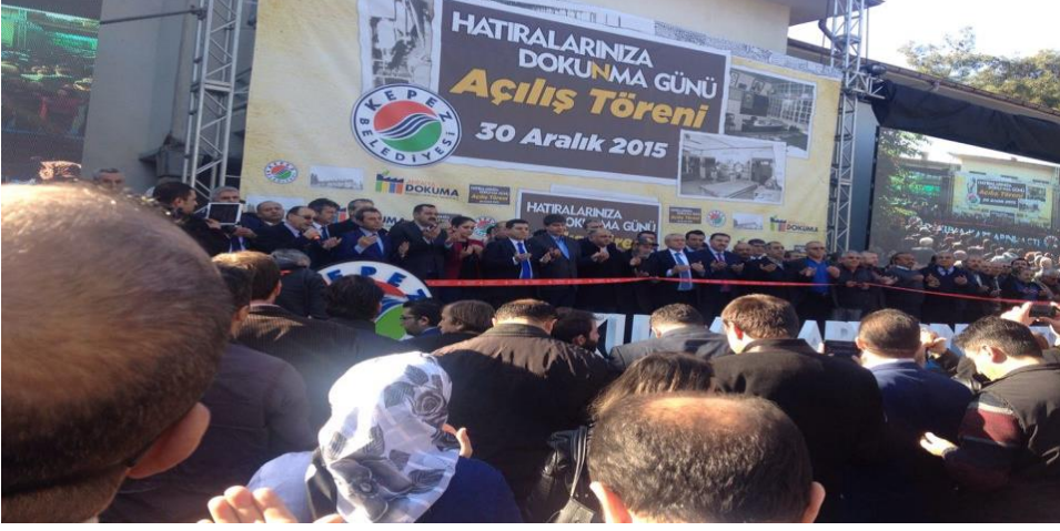
30.12.2015. Dokuma Parkın Açılışı