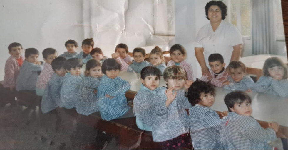
Dokuma Kreşi