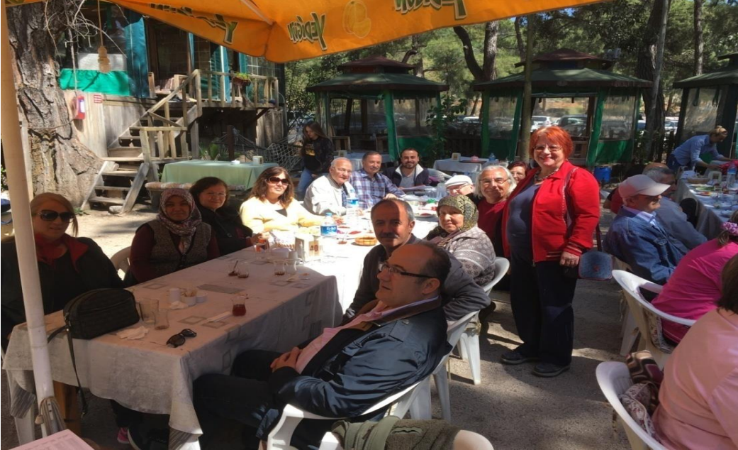
27.03.2017 Antalya akırlar'da Kahvaltı Etkinliđi