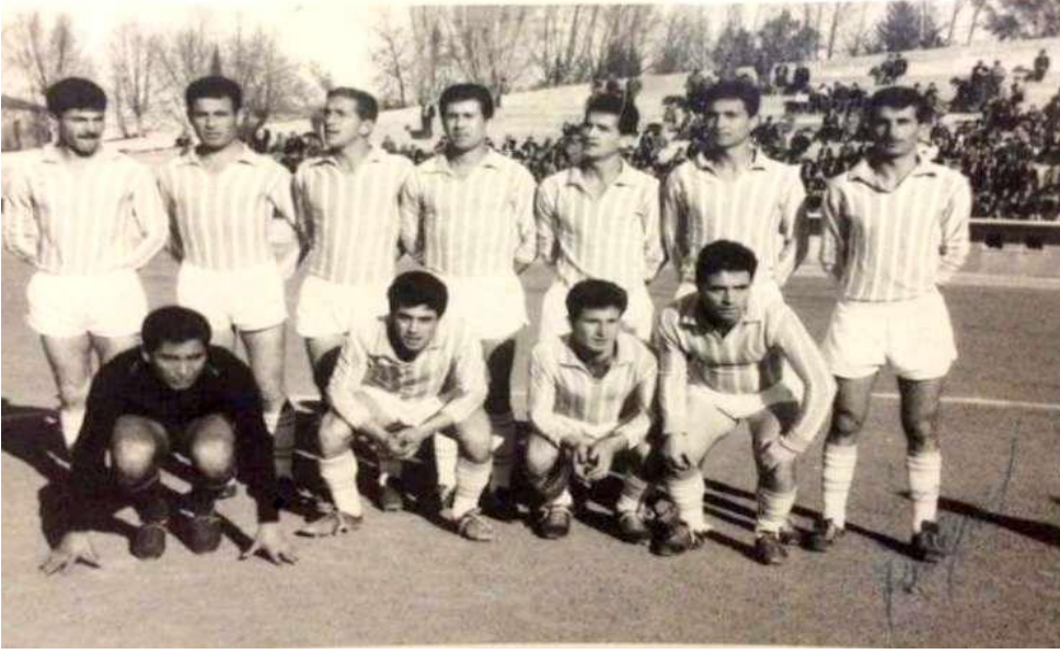
Poplin Spor