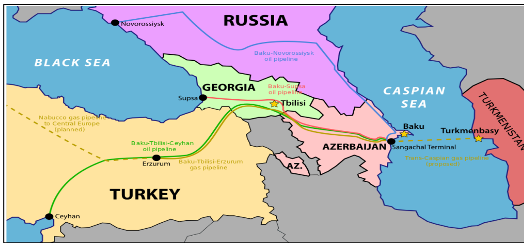
Harita 3.2 Bakü- Tiflis- Erzurum Doğal Gaz Boru Hattı Projesi

Bakü- Tiflis- Erzurum (BTE) doğal gaz boru hattı projesi, Bakü- Tiflis- Ceyhan Ham Petrol Boru Hattı Projesinden (BTC HPBH) sonra bölgede gerçekleştirilen ikinci büyük boru hattı projesidir. Dolayısıyla doğu-batı enerji koridorunun ikinci bileşeni olarak nitelendirilmekte olan söz konusu proje ile Azerbaycan'ın Hazar Denizi'nde bulunan Şah Deniz sahasından üretilen doğal gazın, Gürcistan ve Türkiye kanalıyla Avrupa'ya aktarılmasını amaçlanmıştır. 278 Toplam maliyeti 2.3 milyar dolar ve yıllık kapasitesi 20 milyar metreküp olan BTE doğal gaz boru hattı, 691 km uzunluğundadır. 279 443 km'si Azerbaycan, 248 km'si Gürcistan sınırlarından geçen boru hattı, sosyal ve çevresel zararları azaltmak adına BTC HPBH'na paralel çekilmiştir. Böylelikle proje maliyeti aza indirgenirken söz konusu iki proje güzergah bakımından benzer stratejik etkilere sahip olmuştur. 280