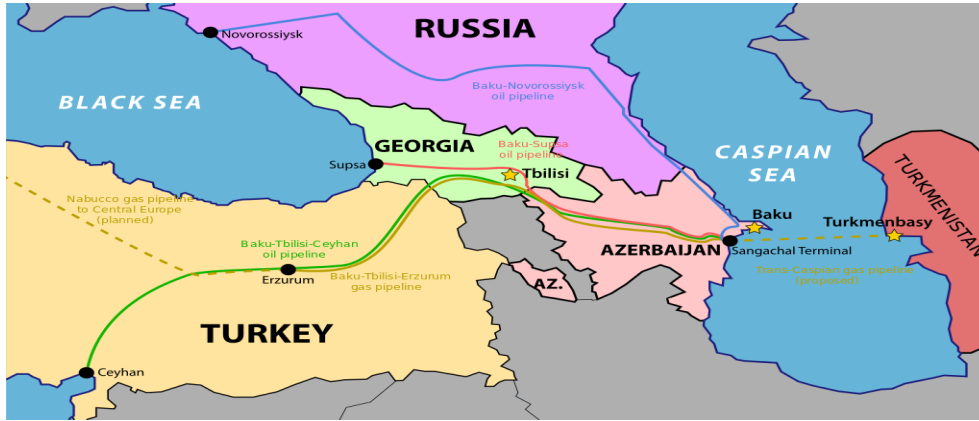
Harita 3.1 Bakü-Tiflis-Ceyhan Boru Hattı Projesi 263

terminaline uzanmaktadır. Bahsi geçen petrol boru hattının 249 km'si Gürcistan'da, 443 km'si Azerbaycan'da ve 1076 km'si Türkiye'de yer almaktadır. 261 Yıllık 50 milyon ton, günlük 1 milyon barel kapasitede olan hat, tam kapasiteye ulaşıldığında dünya petrol arzının %1.3 nü gerçekleştirecek konumdadır. Ayrıca BTC HPBH ile tarihte ilk kez Hazar Denizi ile Akdeniz arasında doğrudan bağlantı sağlanmıştır. 262