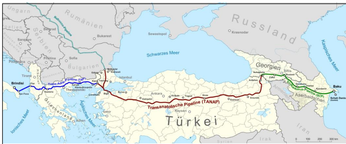
Harita 3.3 Trans Anadolu Doğal Gaz Boru Hattı Projesi 288

Trans Anadolu Doğal Gaz Boru Hattı Projesi (TANAP), Azerbaycan'ın Şahdeniz II sahası ve Hazar Denizi'nin güneyindeki diğer sahalarda üretilen doğal gazın Gürcistan'dan Türkiye'ye ve Türkiye üzerinden Avrupa'ya aktarılmasını amaçlayan bir projedir. TANAP projesini BTE (Güney Kafkasya) doğal gaz boru hattı projesinden farklı kılan husus, yalnızca Azerbaycan- Türkiye ortaklığına dayanan bir enerji işbirliği örneği olmasıdır. Ayrıca TANAP projesi kapsamında inşa edilecek boru hattı, BTE (Güney Kafkasya) doğal gaz boru hattı (SCP) ve Trans- Adriyatik Boru Hattı (TAP) ile birleşerek güney doğal gaz koridorunu oluşturmaktadır. 287