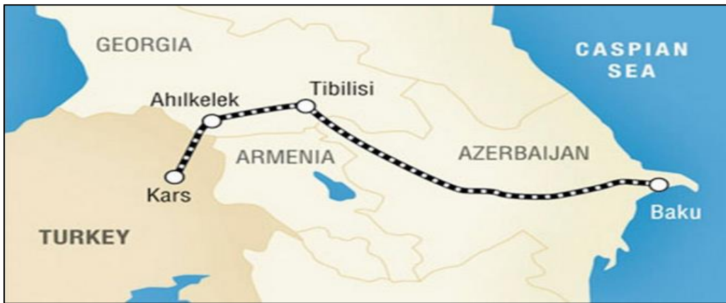
Harita 3.4 Bakü-Tiflis- Kars Demiryolu Projesi

Bakü-Tiflis-Kars Demiryolu Projesi kapsamında inşa edilen, Türkiye'nin Kars şehrinden geçerek oradan da Gürcistan'ın Ahılkelek şehrine uzanan demiryolu hattının uzunluğu 105 km olup, 76 km'si Türkiye'den 29 km'si Gürcistan'dan geçmektedir. Proje kapsamında belirtilen Azerbaycan ile Gürcistan arasında Sovyetler Birliği döneminden bu yana kullanılmakta olan demiryolu hattı ise, Ahılkelek'ten Tiflis şehrine ve ardından Azerbaycan'ın başkenti Bakü'ye uzanmakta olup, uzunluğu 721 km'dir. 300