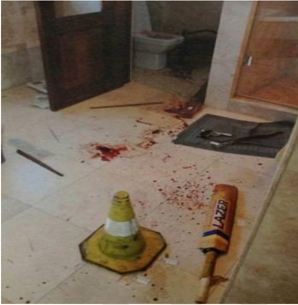
Görsel 2. Olay Yeri Fotoğrafı 1