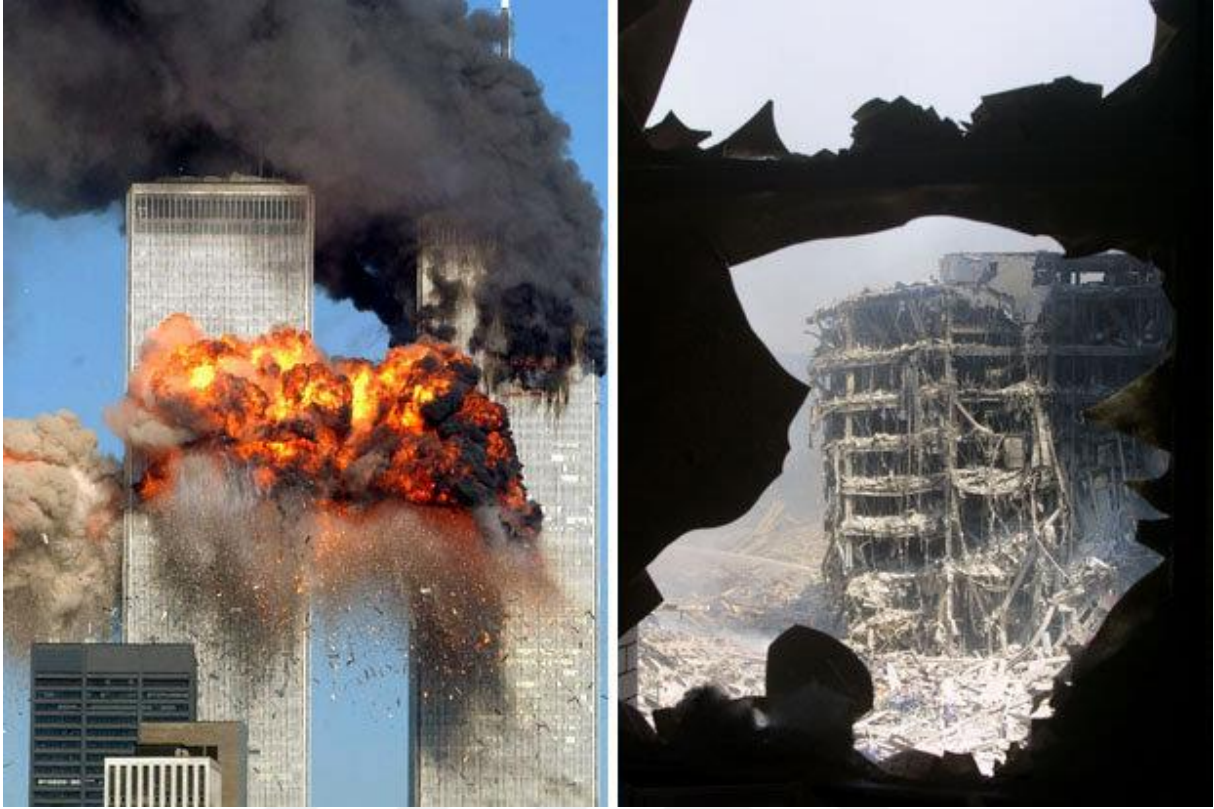
Görsel 5. 11 Eylül/ İkiz Kuleler

Suçu hatırlatan fotoğraf kategorisinde iki önemli unsur bulunmaktadır. İlki bireysel düzey, diğeri ise toplumsal düzeydir. Burada önemli olan bellek/hafızadır. Bireysel bellek, kişinin deneyimlerinden ve yaşadıklarından yola çıkarak elde ettiği birikimdir. Toplumsal bellek ise, görsel kültür bağlamında bir araya gelmiş insanların tarihsel süreç içerisinde edindikleri deneyimleri kapsar. Bir fotoğrafın, suç hatırlatan fotoğraf kategorisinde ele alınmasında, kişinin ve toplumun hafızası belirleyici niteliktedir.