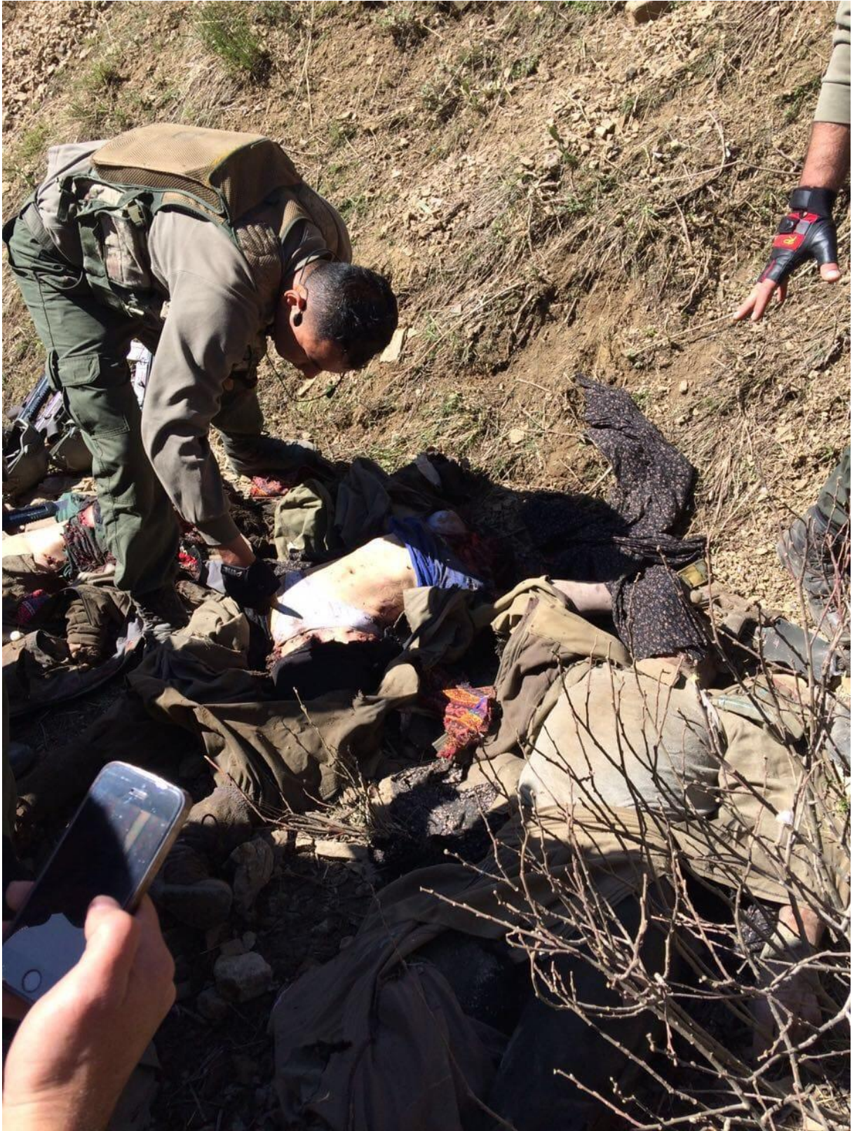
Görsel 1. Terörle Mücadele Operasyonu/ Diyarbakır

Fotoğraf analizlerinde, daha derin analizler yapabilmek, fotoğraf tekniği, kültürü ve kişisel bilgimize ve farklı alanlardaki bilgi ve deneyimlerimize bağlı olarak daha üst düzeyde gerçekleştirilmesi ile mümkün kılınabilir. Analizin etkinliği, çeşitli gözlemlerin birbirileri