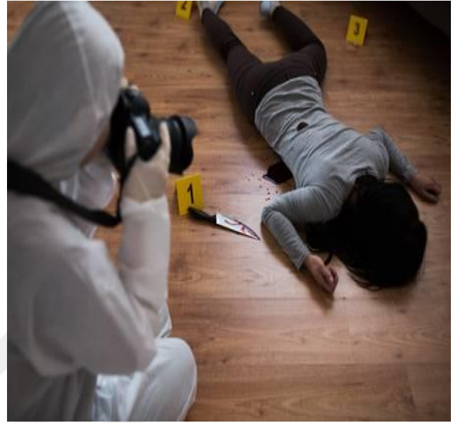
Görsel 3. Olay Yeri Fotoğrafı 2

Kriminal fotoğraflar, özellikle olay yeri incelemesine katkısı çok büyük olan fotoğraflar olarak ele alınabilir. Herhangi bir müdahale gerçekleşmeden, olay yerinin olduğu gibi fotoğraflanmasını içermektedir. Yakın-uzak-detay çekimler şeklinde gerçekleştirilir. Her delil ayrı ayrı fotoğraflanır. Kanıtlar bozulabilir, yok olabilir, sonradan değiştirilebilir bu sebeple suçlu veya suçluların bulunmasında olay yerinin olduğu gibi fotoğraflanması büyük önem taşımaktadır. Görsel kriminoloji kapsamında fotoğrafların sınıflandırılması açısından temel kategoriye oluşturmaktadır. Bu yönüyle kriminal fotoğraflar, hukuksal görme biçimi ile kanıt niteliği taşıdığından önemi artmaktadır.