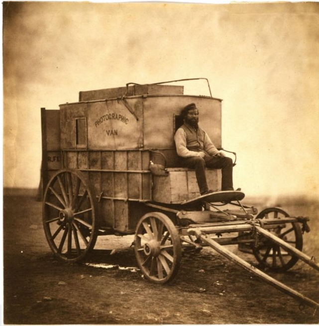
Görsel 5. Roger Fenton ve Fotoğraf Arabası

1855–1856 yıllarına baktığımızda ise ilk savaş fotoğrafçısı olarak bilinen Roger Fenton Kırım Savaşı'nı fotoğraflayarak o döneme ait yaşama koşullarını yansıtmıştır. Bu anlamda çektiği fotoğrafların belge niteliği ön plana çıkmaktadır.