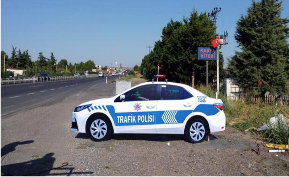
Görsel 6. Maket Trafik Polisi Araçları

Suçü önleme de caydırıcılığın önemi kriminoloji tarihi boyunca yer almıştır. Fotoğraf sınıflandırmasında da suçü önleyen fotoğraf kategorisinin temel amacı aynı şekilde suç gerçekleşmeden caydırmak, vazgeçirmek, engellemeye yönelik olmasıdır. Bu sebeple, suçun gerçekleşmesi durumunda alınacak ceza ve karşılaşılabacak süreçleri anlatan her türlü görsel bu kategoriye girmektedir. Görsel 6’da yer alan, ülkemizde uygulanan maket trafik polisi araçları buna bir örnek teşkil etmektedir.