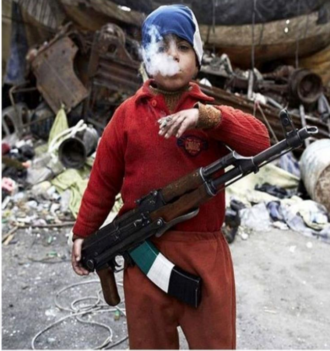
Görsel 7. Suç Ortamında Çocuk

Bu kategori, fotoğrafın belgeleyici olma niteliği ile birlikte suçun ve suçlu davranışın gösterilmesiyle sınıflandırmada kolaylık sağlama özelliği taşımaktadır. Aynı zamanda bireyin içinde bulunduğu sosyal çevreden ayrı düşünülmemeyeceğini göstermektedir. Bu kategorideki fotoğraflar, suçu önleme çalışmalarına da yardımcı olabilecek niteliktedir.