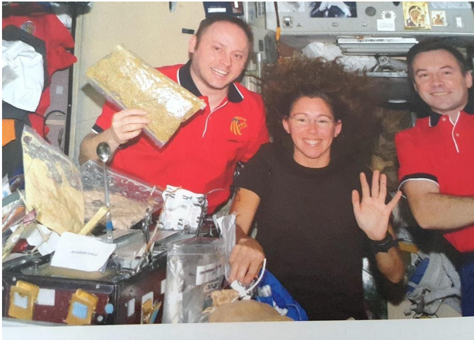
EK- 8 : 5. Sınıf Türkçe Ders Kitabı ‘Uzayda Bir Gün’ Metni Görseli