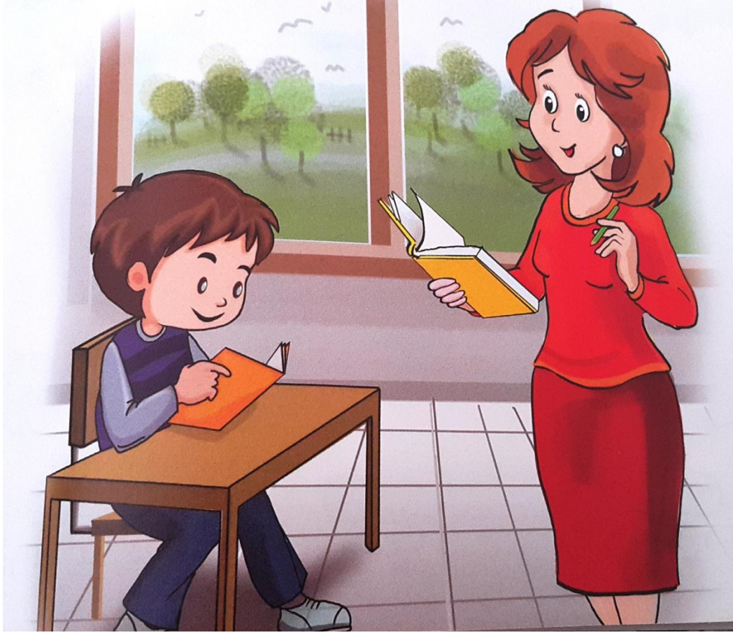
EK- 7: 5. Sınıf Türkçe Ders Kitabı ‘Okuma Kitaplarım’ Metni Görseli