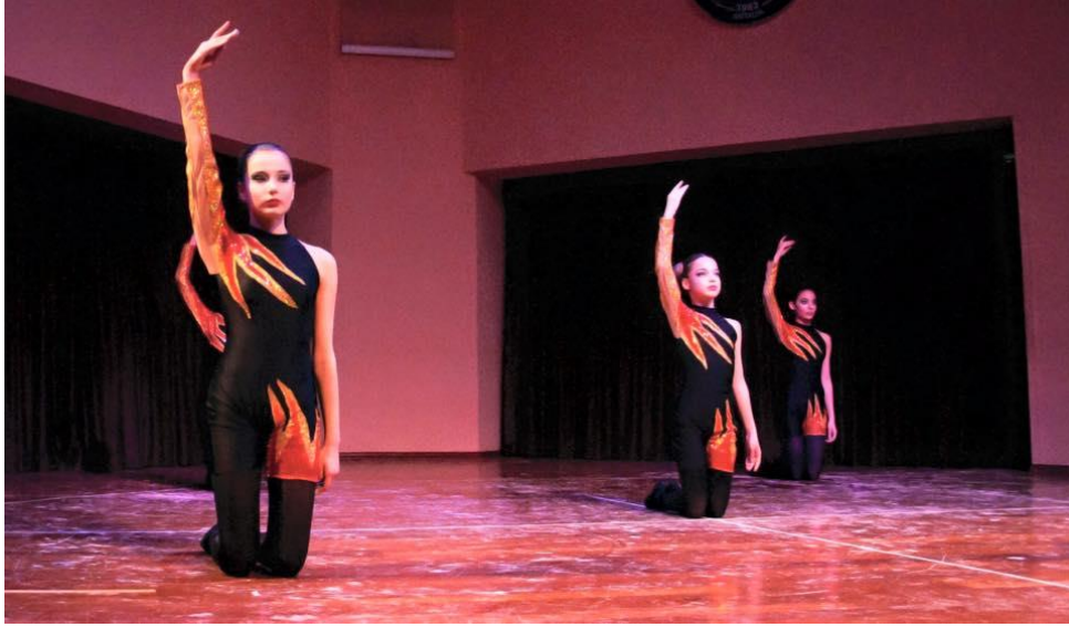
Fotoğraf 4.1. 23 Nisan 2015 Ulusal Egemenlik ve Çocuk Bayramı Kutlama Konseri

10 Kasım 2016 tarihinde Atatürk'ü Anma Töreninde öğrenciler tören programlarının yanı sıra müzik dinletisi ve bale gösterisi yaptılar. O güne ait bir fotoğraf.