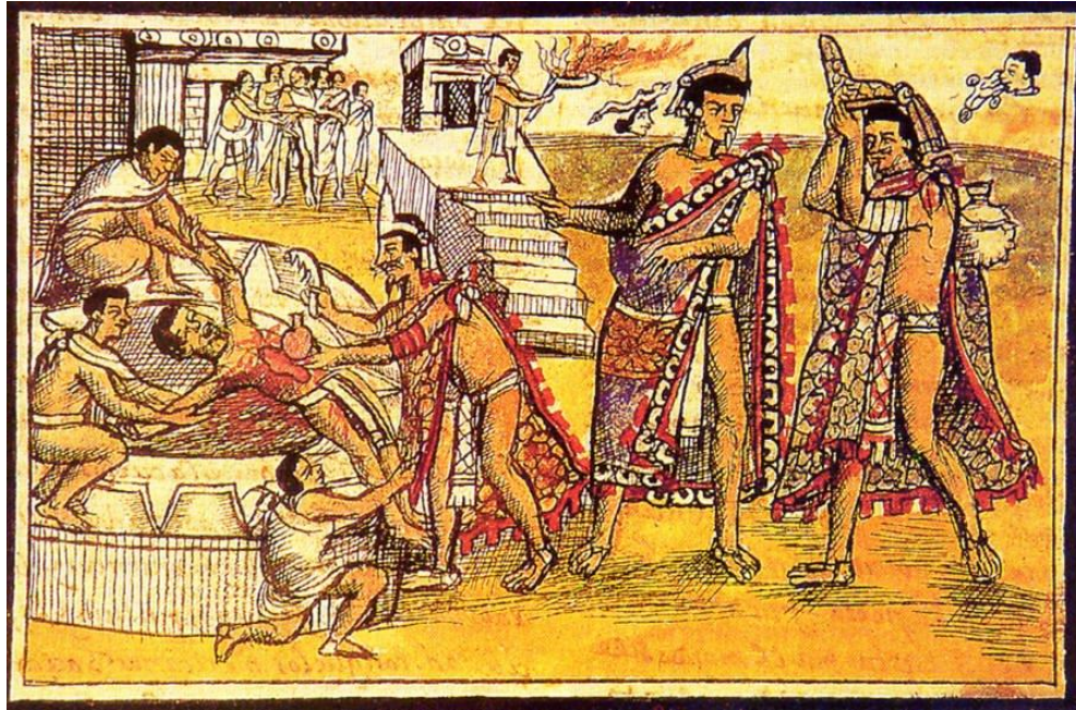
Görsel 3.1. Aztekler'in Kanlı Kurban Törenleri