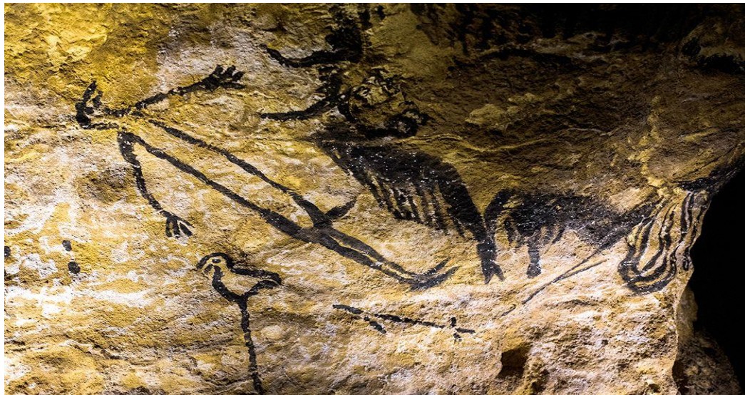
Görsel 2.1. Lascaux Mağarası, Fransa (Dordogne, Montignac)