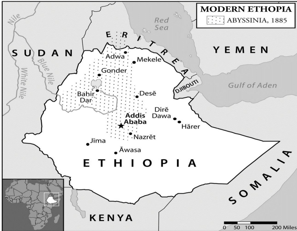
Harita 1.1 Modern Etiyopya ve Habeşistan, 1885