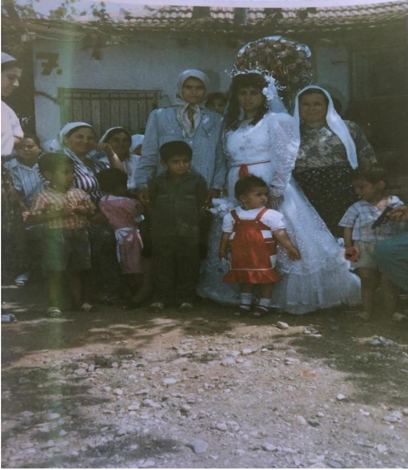
Fotoğraf 17. Ođlan evinde gelin ve gelini görmeye gelen misafirler