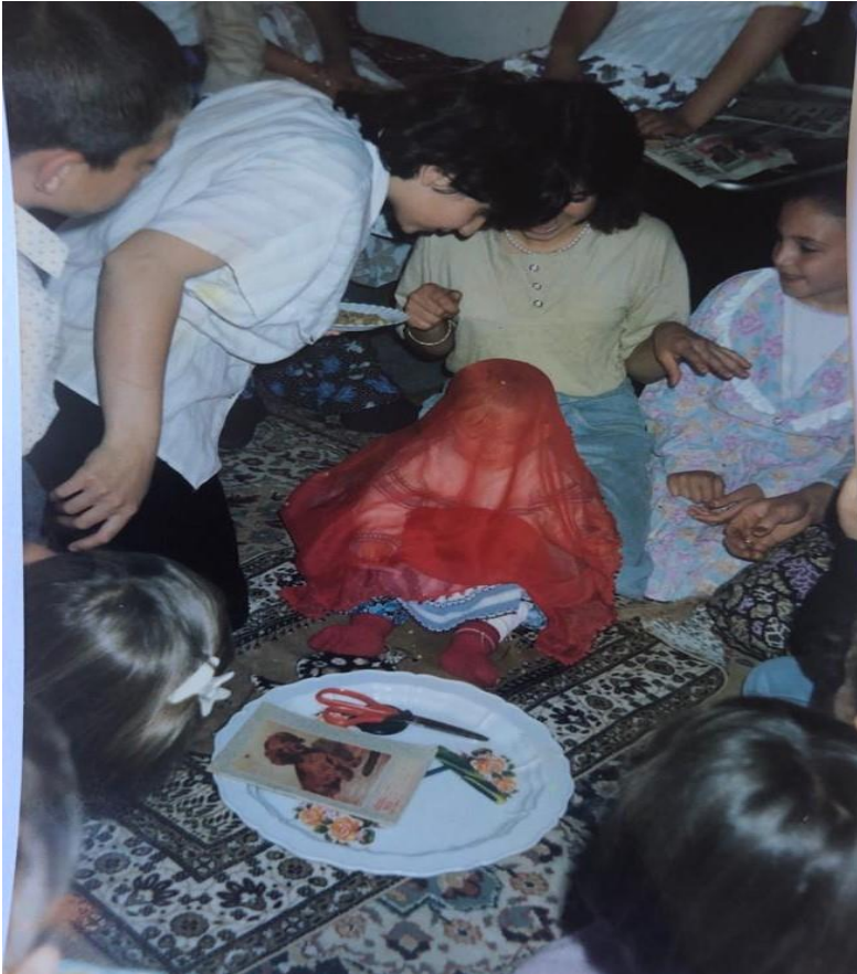
Fotoğraf 2. Diş dirgitinde çocuk tepsiye konulan eşyaları seçerken