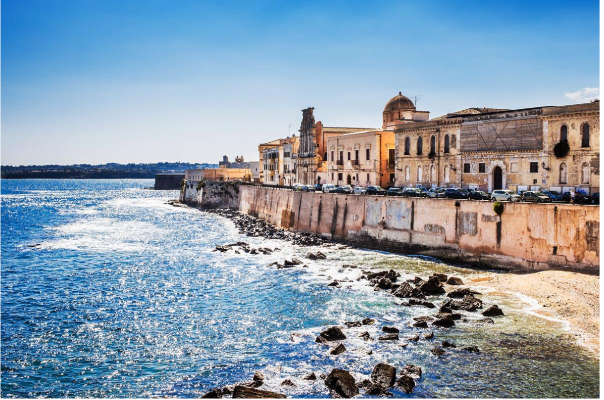
Fotoğraf 2. Siracusa, Esed b. el-Furât'ın, kuşatması esnasında vefat ettiği şehir