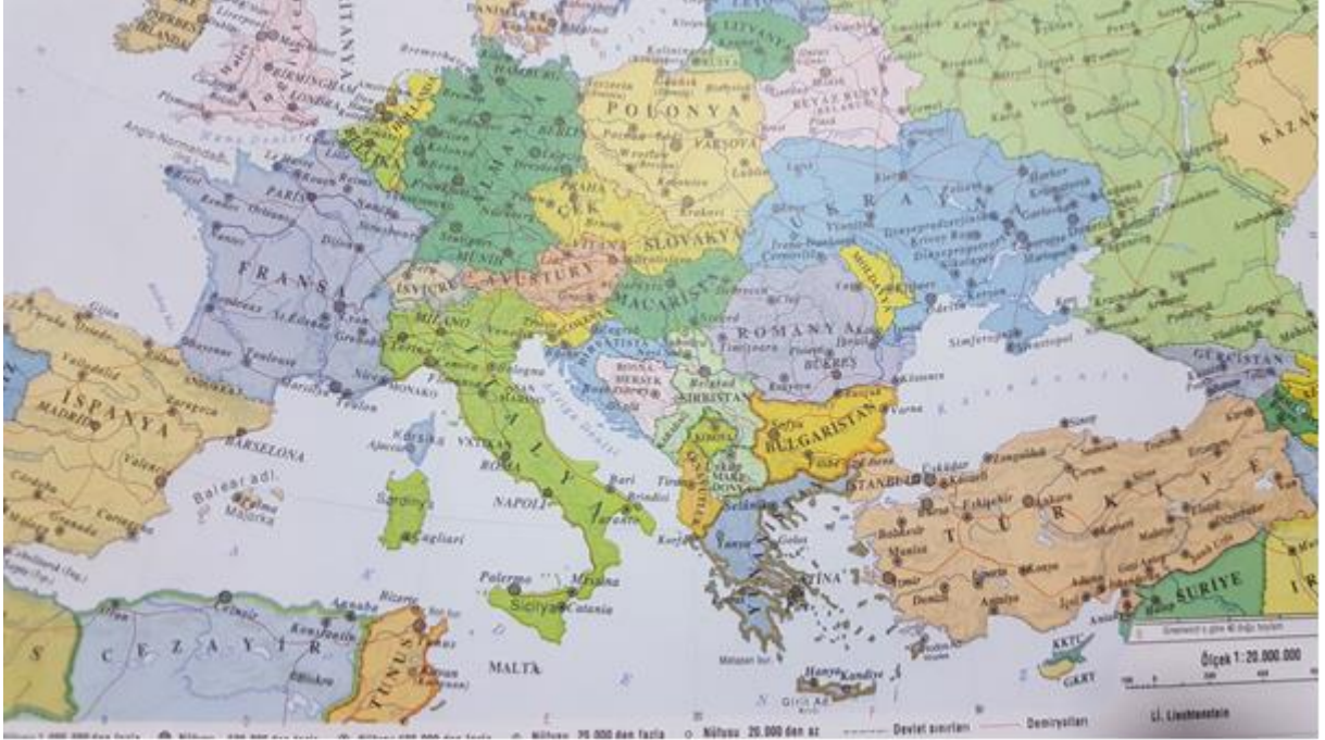
Harita 2. Sicilya'nın diğer ülkelere göre konumu,

Kaynak: Duran, Faik Sabri, Büyük Atlas , İstanbul, 2006, s. 33.