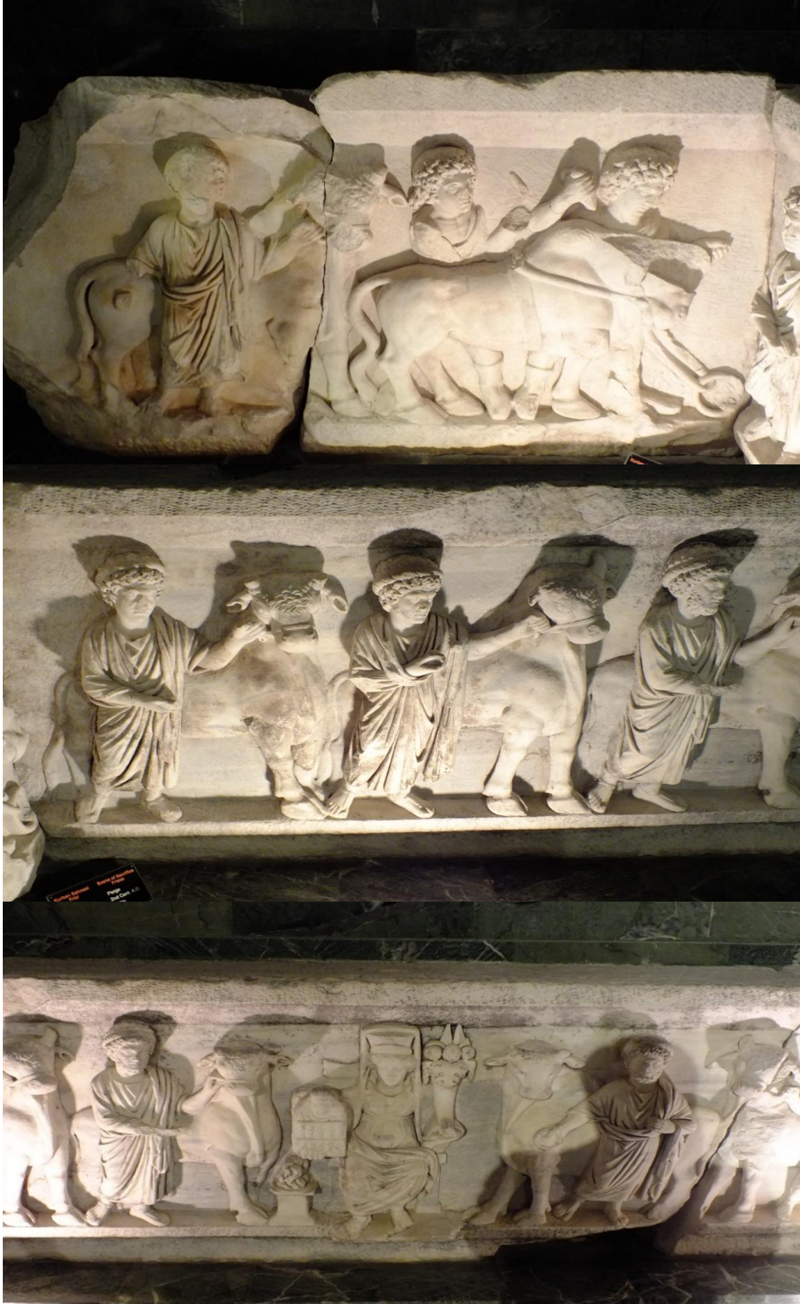
Kurban Sahnesi, Antalya Müzesi.