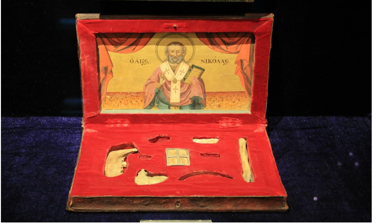
Aziz Nicholas'un Rölükleri, Antalya Müzesi